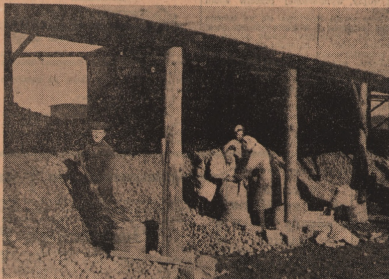
Pracująca ludność miejska zaopatruje się na zimę w ziemniaki w licznych punktach sprzedaży istniejących we wszystkich miastach. Na zdjęciu: Pracownicy portu i stoczni w Gdyni zaopatrują się w ziemniaki na punkcie sprzedaży w Gdyni.

— Nie oddamy sztandaru nikomu — mówią przodownicy pracy. Nasz zakład zdobył pierwsze miejsce w Polsce i na tym zaszczytnym miejscu pozostaniemy. Postaramy się o to. Nowe tysiące ton mieszanek, nowe tysiące płyt podszewkowych — to nasz wkład w realizację wielkiego programu Frontu Narodowego.