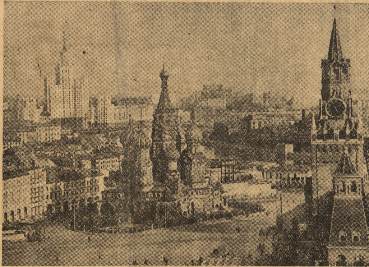
Widok od strony Placu Czerwonego