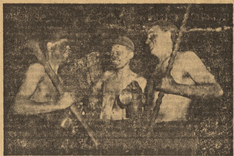
Kopalnia węgla kamiennego w Sośnicy należy do przodujących w przemyśle węglowym. Plan za wrześnię wykonano w 100,9 proc., za październik — dzięki podjętym zobowiązaniom w 104,4 proc.

Już 13 rębaczy z załogi kopalni wykonało zadania Planu 6-letniego. W listopadzie załoga zaciągnęła, dla uczczenia 35 rocznicy Rewolucji Październikowej, 778 indywidualnych i 554 zespołowe warty produkcyjne.