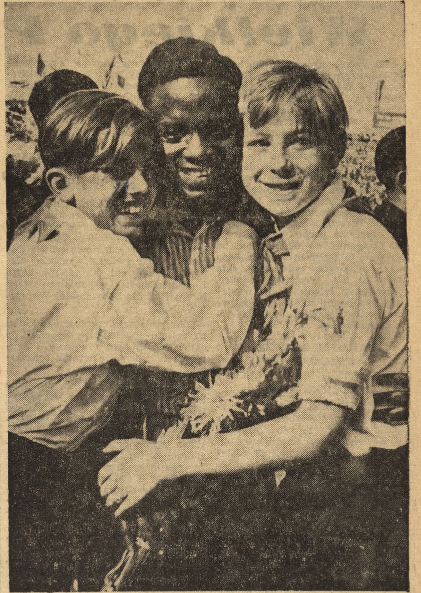
W dniu 10 listopada cały świat postępowy obchodzi uroczyste Międzynarodowy Dzień Młodzieży. NA ZDJĘCIU: Młodzież NRD pozdrawia serdecznie jednego z przedstawicieli młodzieży murzyńskiej na III Światowym Zlocie Młodych Bojowników o Pokój w Berlinie.