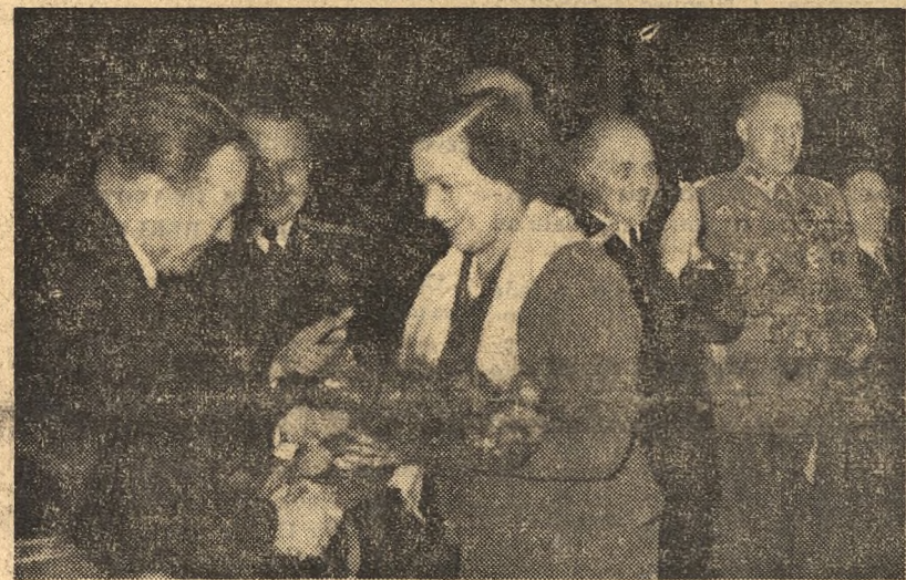
W części artystycznej akademii zorganizowanej przez Komitet Centralny Polskiej Zjednoczonej Partii Robotniczej z okazji XXXV rocznicy Wielkiej Socjalistycznej Rewolucji Październikowej, wystąpili laureaci Nagrody Stalinowskiej, ludowi artyści ZSRR z Teatru im. „Mossowietu”. NA ZDJĘCIU: Przedstawicielka Teatru im. „Mossowietu” wręcza kwiaty Prezydentowi Bolesławowi Bierutowi.