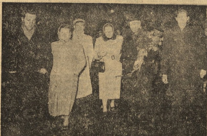
W związku z Miesiącem Pogłębienia Przyjaźni Polsko-Radzieckiej na zaproszenie TPPR przybyła do Warszawy w dniu 6 bm. delegacja Wszechzwiązkowego Towarzystwa Łączności Kulturalnej z Zagranicą (WOKS).

Na dworcu w Warszawie gości radzieckich powitali przedstawiciele Zarządu Głównego TPPR, Związku Literatów Polskich oraz liczne rzesze studentów Uniwersytetu Warszawskiego i SGPiS.