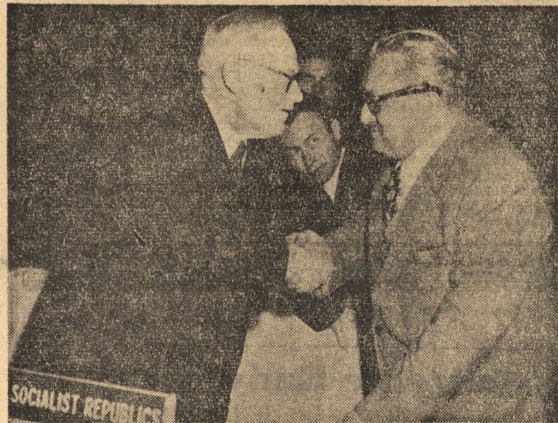
NA ZDJĘCIU: Minister Spraw Zagranicznych Związku Radzieckiego ANDRZEJ WYSZYŃSKI i Minister Spraw Zagranicznych Polski STANISŁAW SKRZESZEWSKI na sali obrad.