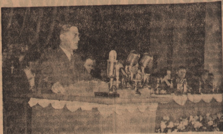
Na zdjęciu: W imieniu Rządu i Komitetu Centralnego PZPR wita Naradę wicepremier i sekretarz KC PZPR Aleksander Zawadzki.