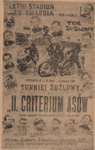
Wielki żużlowy turniej „II Criterium Asów” w Bydgoszczy...