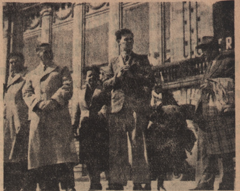
W Szczecinie bawiła grupa Polaków z Francji członków Towarzystwa Obrony Granic na Odrze i Nysie. Rodacy z Francji zapoznali się m. in. z portem szczecińskim i inwestycjami Planu 6-let-

niego oraz zwiedzili zamek piastowski i inne zabytki historyczne i kulturalne.