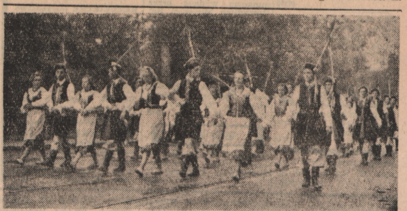
Fragment defilady Zespołów Ludowych na dożynkach w Krakowie