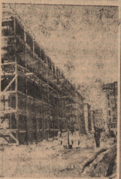
W Warszawie na zapleczu ulicy Nowy Świat buduje się tzw. ciąg pieszy. Na zdjęciu: Fragment budowy ciągu pieszego między ul. Foksal a ul. Ordynacką.

Dziś wiemy, że lata władzy ludowej nie tylko odrobiły olbrzymie zafocowanie lat poprzednich i zniszczenie wojenne, ale podniosły produkcję przemysłową o 300 procent, zaspokoili głód ziemi milionów chłopów i podniosły jego stopę życiową, zlikwidowały wyzysk obszarnika i kapitalisty, podniosły poziom kultury i oświaty mas, zdrowotność ludzi pra-