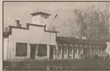
Tu będziemy mieli okazję obejrzyć premierę

15 marca o 18 00 w Ośrodku Edukacji Teatralnej przy ul. Szkolnej odbędzie się premiera nowego spektaklu Teatru im. Alberta Tison The sieć . Sztuka ta jest podobno zupełnie odmienna od dotychczasowych przedstawień tisończyków.