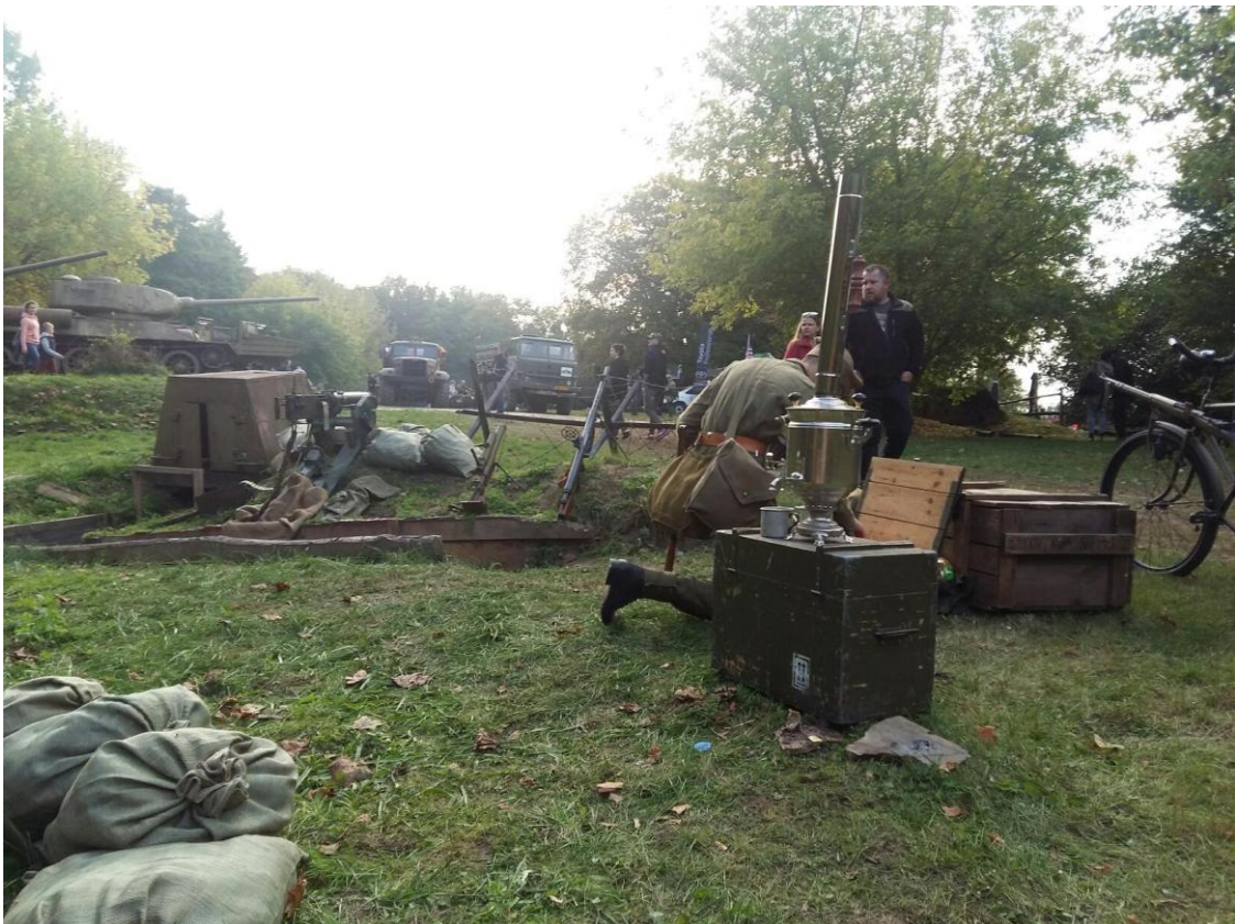
Są też częstym gościem na Wielkiej Księżej Górze w Grudziądzu.