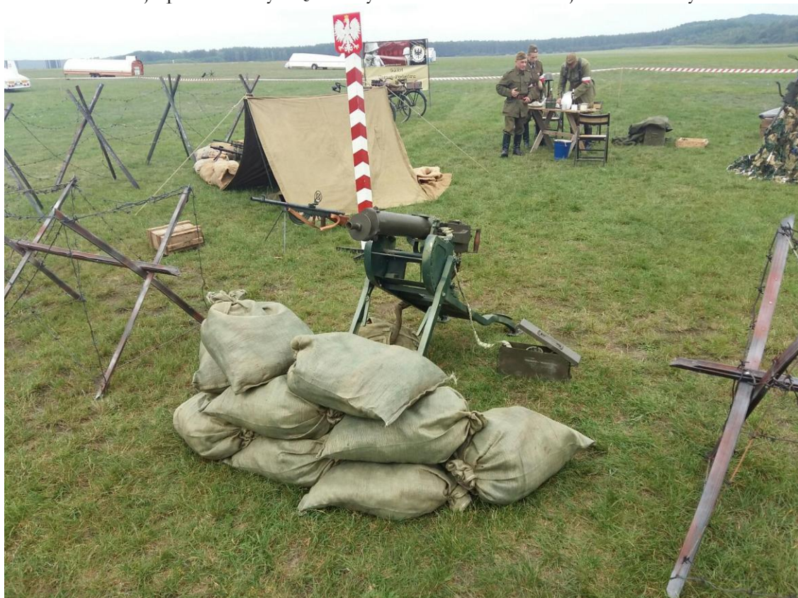
Lisie Kąty sierpień 2021 r. wraz z Fundacją Lotniczy Grudziądz, weekend z gen. Mirosławem Hermaszewskim z okazji rocznicy jego pierwszych lotów.