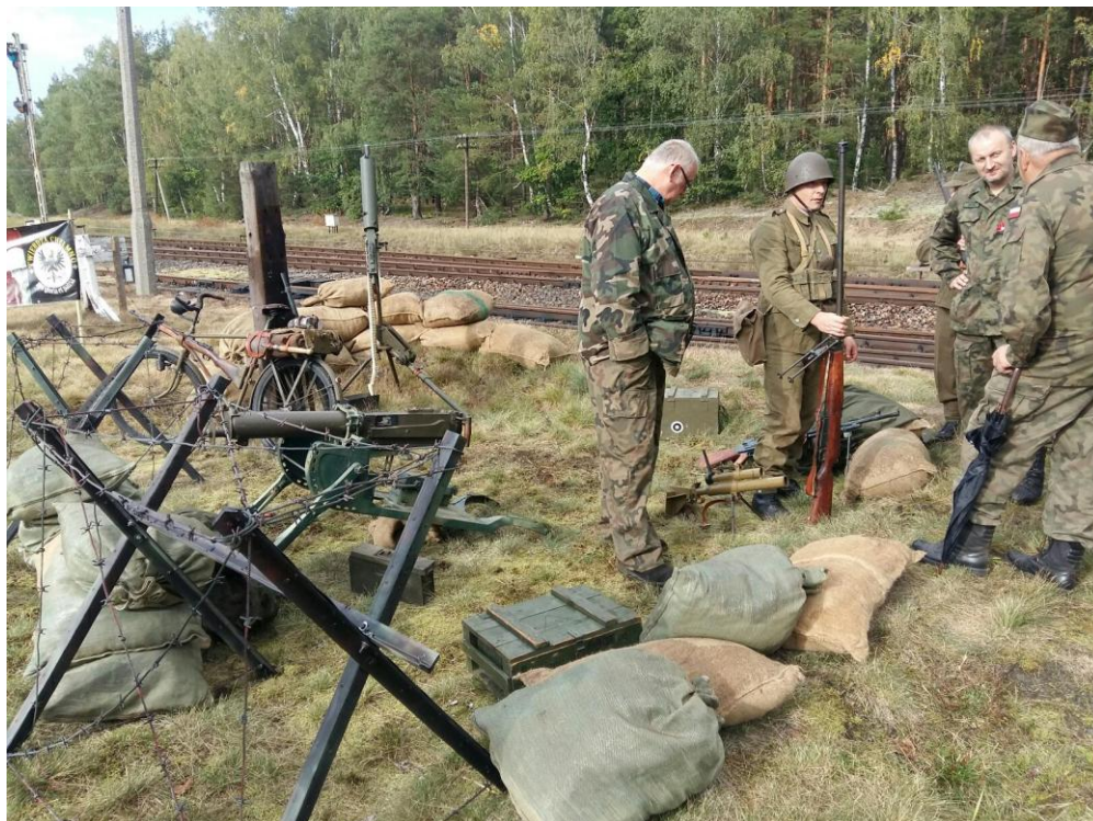
Wierzchucin 9.2023, dawny poligon rakiet V2.

Prowadzimy także stronę na portalu społecznościowym Facebook, na którym promujemy się oraz opisujemy wydarzenia, w których braliśmy udział.