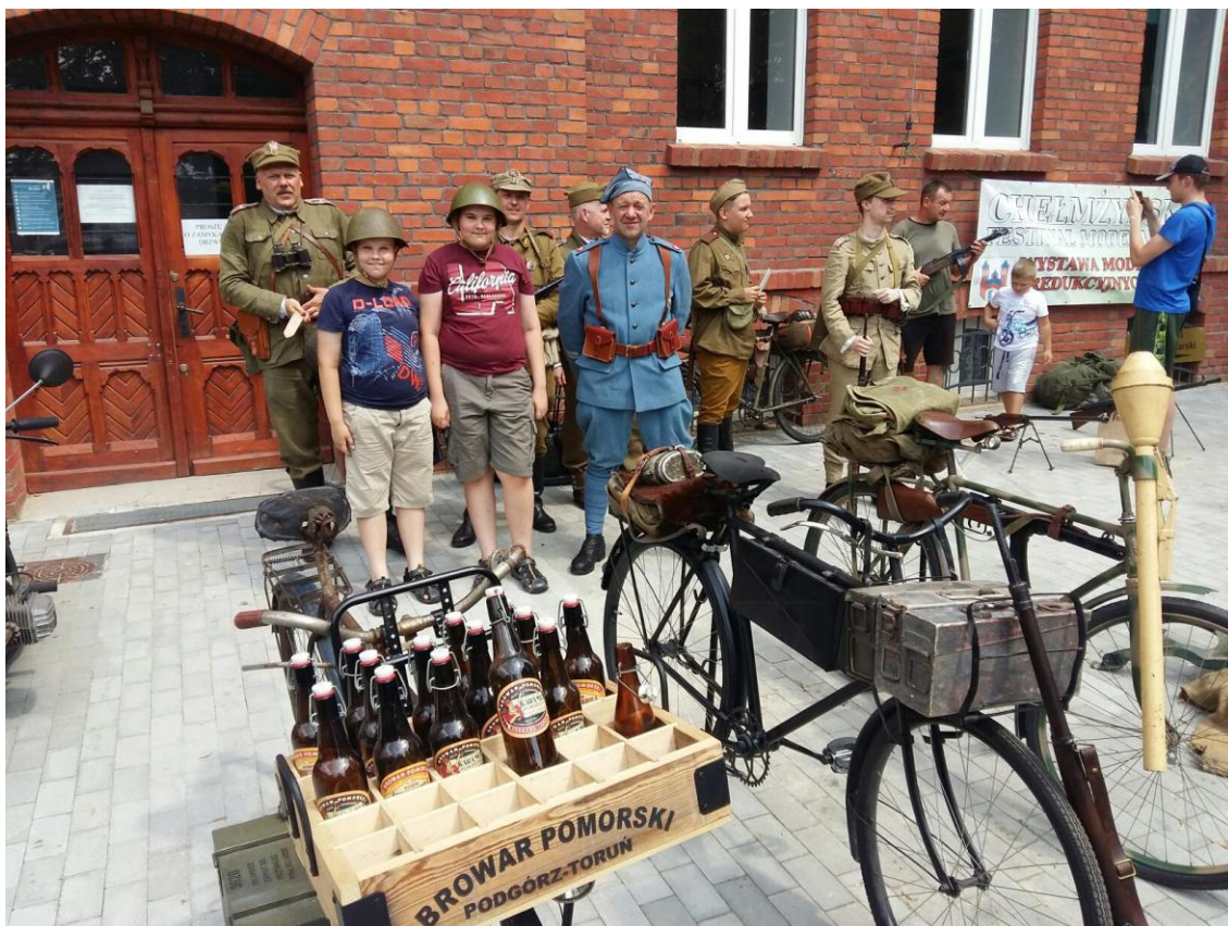
Tutaj spotkałiśmy się na wystawie modelarskiej w Chełmży.