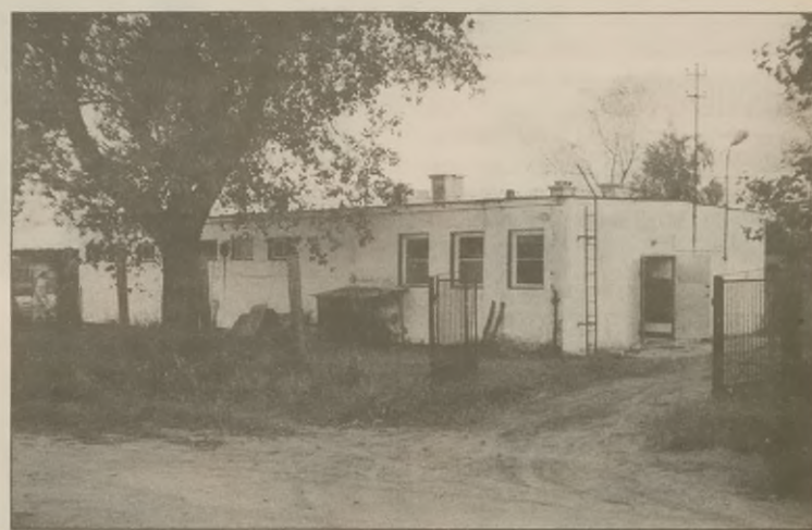
W tym budynku przy ulicy Młyńskiej 8 w Janowcu urządził przetwórcę rybny, którą tutaj przeniósł z Placu Wolności we wrześniu 1995 roku