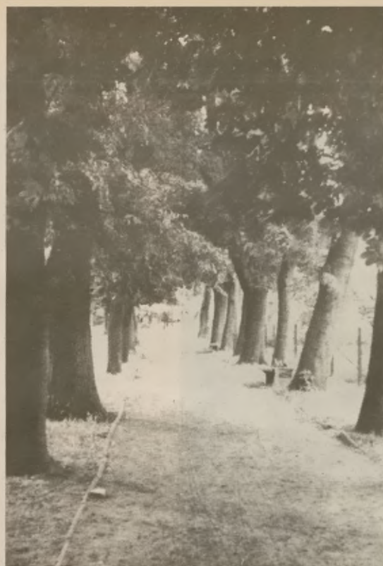
Aleja w żnińskich plantach