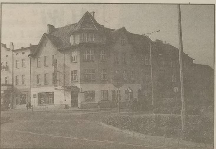
Budynki PSS przy ul. Pl. Wolności 2 i Hallera 1

Z przepisów artykułu 4 ustęp 6 ustawy o gospodarce gruntami i uwłaszczeniu nieruchomości wynika wprawdzie możliwość nieodpłatnego przekazywania w użytkowanie lub w użytkowanie wieczyste nieruchomości, ale odnosi się to wyłącznie do osób prawnych bądź fizycznych, które prowadzą działalność charytatywną, opiekuńczą, leczniczą, oświatową czy wychowawczą. Nie wchodzi w grę natomiast prowadzenie działalności zarobkowej. cd. na s. 5