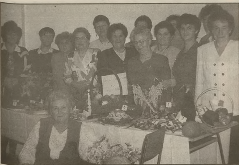
Panie z kół gospodyń przy stole