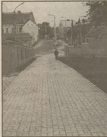
Schody prowadzące na ulicę Marii Konopnickiej.