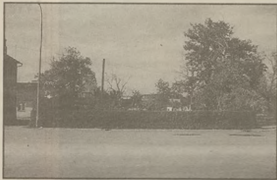
Janowiec, ul. Młyńska. Za widocznym parkiem znajdują się działki z ogródkami warzywnymi, drzewami owocowymi i budynkami, w których rodziny te trzymają swój inwentarz i opal na zimę. Syndyk chce ten grunt sprzedać komuś innemu

nym budować pomieszczenia gospodarcze. Mało tego - jak mówi Teodor Cholewiński - GS pomagała im jeszcze dając materiał (np. deski) na budowę szopek. W