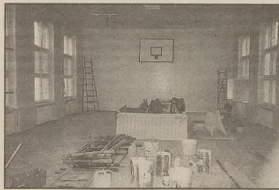
Sala gimnastyczna w czasie remontu.