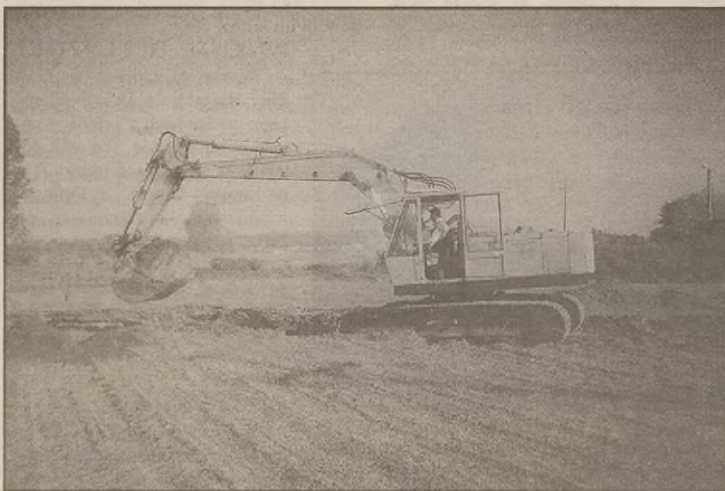
Andrzej Przybyszewski kopie rów pod budowę kanalizacji ściekowej.