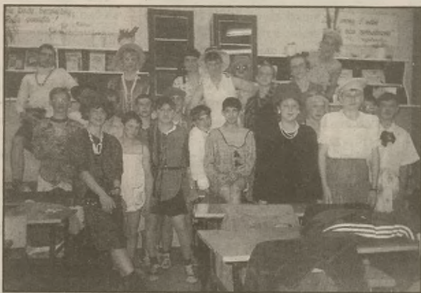
Modelki (klasa męska!) z klasy Technikum Rolniczego