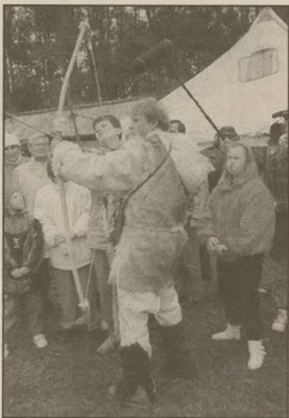
Dzieciaki z Mogilna i Żnina na stanowisku lucznicychym

wana glina, siadać za kołem i pod czujnym okiem garncarza spróbować swych sił. Wszystkim wybornie smakowały podplomyki, specjal naszych