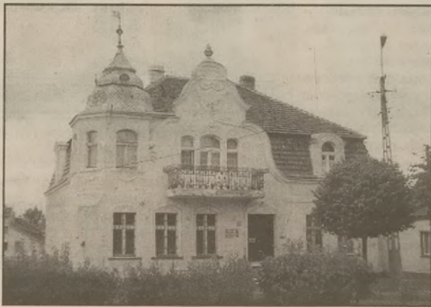
Piękny budynek Banku Spółdzielczego jest ozdobą Rogowa.

Powstały w 1976 roku Bank Gospodarki Żywnościowej przejął funkcję centrali finansowej w odniesieniu do SOP, które przybrały nazwę Banków Spółdzielczych. Przejęły one między innymi pełną obsługę finansowo-kredytową jednostek i zespołów związanych z rolnictwem.