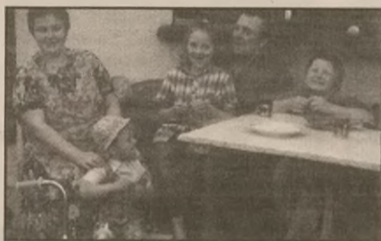
Rodzina przed domem.