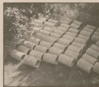
Rury złożone na podwórku bloku.

W ubiegłym roku Zarząd Gminy rozpropagował na łamach miesięcznika samorządowego wizję Doliny Pięciu Jezior ,