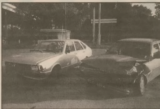
Samochody po kolizji na skrzyżowaniu w Żninie

□ W nocy z 30 na 31 sierpnia mieszkaniec Skórek powiadomił Komendę Rejonową