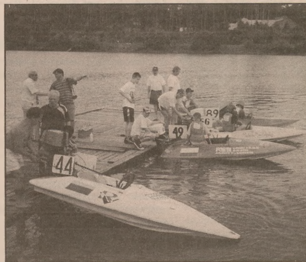
Wodowanie łodzi na rzece Niemen. Łodzie z numerami 49, 56 i 89 to łodzie klubu MKŻ Żnin.