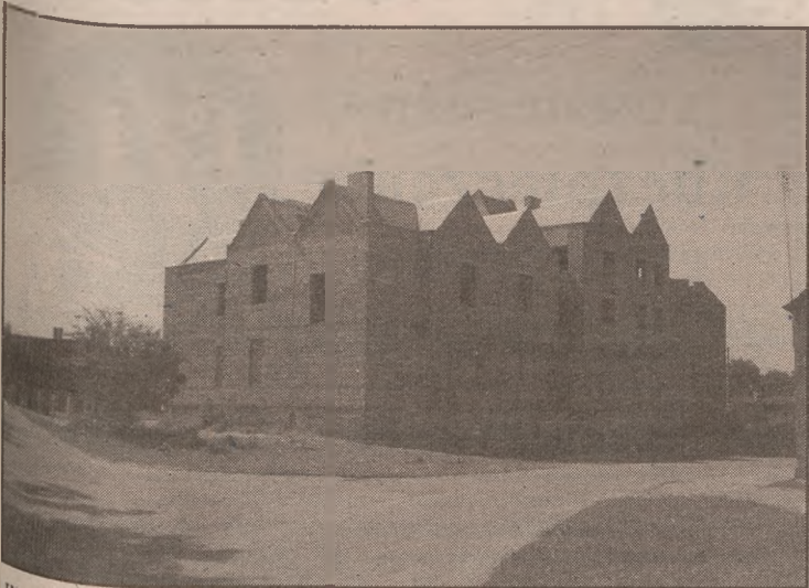
Wspólny budynek banku i poczty w Rogowie, stan obecny

Kazimierz Grochowalski mówi, że nie można było podjąć wykończenia części budynku należącej do banku. Był to czas, kiedy banki spółdzielcze upadały. Jego bank - jak mówi - zawsze stał dobrze, jednak mógłby nie udźwignąć kosztów dokończenia inwestycji.