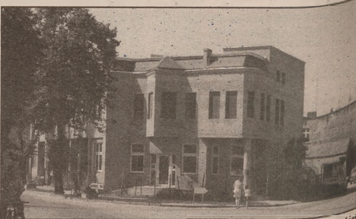
W widocznym na zdjęciu parterze budynku u zbiegu ulic Dworcowej i Gnieźnieńskiej w przyszłości mieścić się będzie apteka

♦ Na 17 października zaplanowano uroczystość nadania Bibliotece Publicznej Miasta i Gminy Gołańcz imienia Wojciecha Kubianka. Równocześnie nastąpi otwarcie Regionalnej Izby Tradycji. Aktualnie poszukuje się wszelakich materiałów związanych z życiem i działalnością tego pałuckiego przedwojennego drukarza, wydawcy i regionalisty. (jóm)