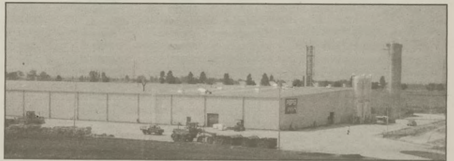
Pepsi - Cola w Żninie.

Kierownik Spółdzielni Mieszkaniowej Zdzisław Goliński powiedział, że blok był remontowany kosztem innych robót. Jego remont kosztuje 210.000 zł. Całość robót obejmuje: naprawę balkonów, założenie nowej izolacji, tj. no-