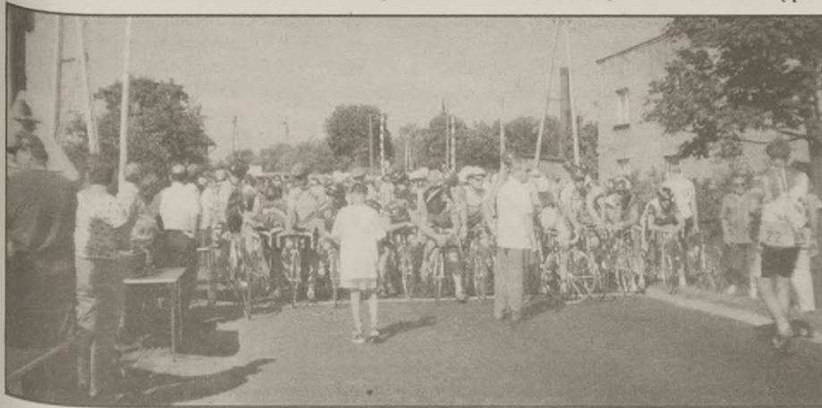
Zawodnicy na starcie w drugim dniu olimpiady