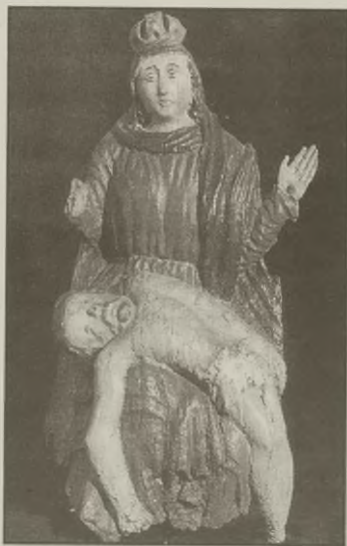
Pieta z Januszkowa, 1841, ze zbiorów A. Hoffmana w Żninie

* Książkę można nabyć w Muzeum Ziemi Pałuckiej w Żninie - Sufragania