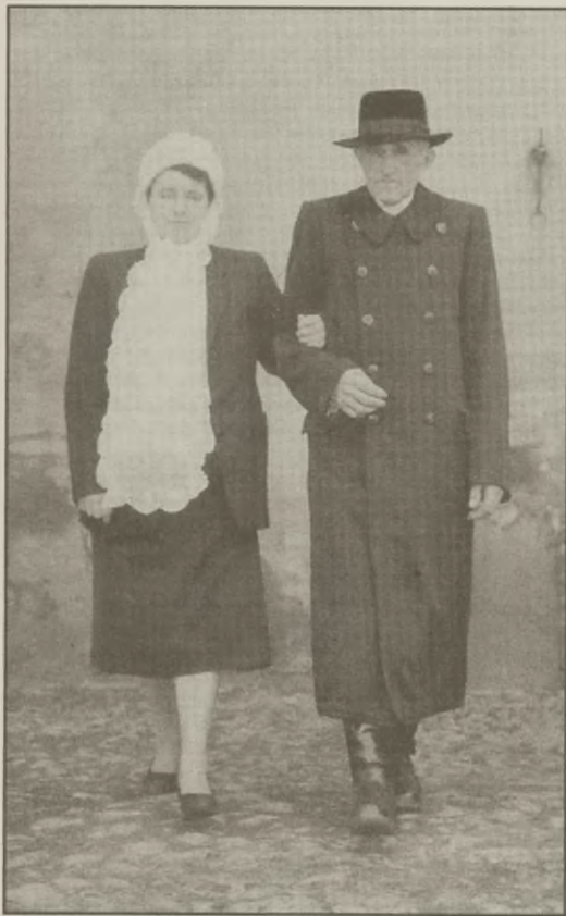
Para Pałuczan w strojach odświętnych, 1958 r., Kcynia

Temat Sztuki Ludowej Pałuk , zwłaszcza ze względu na podtytuł Przeszłość i teraźniejszość zmusza do szerszej refleksji niż tylko zawartość treściowa tej ważnej dla regionu publikacji. Ważnej, gdyż jest to pierwsza próba kompleksowego przedstawienia tradycyjnej sztuki ludowej tego