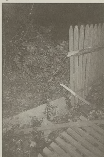
Polamany płot po bójce w Brzyskorzystwi.

rzucać kamienie, które spadały na nich i podwórko.