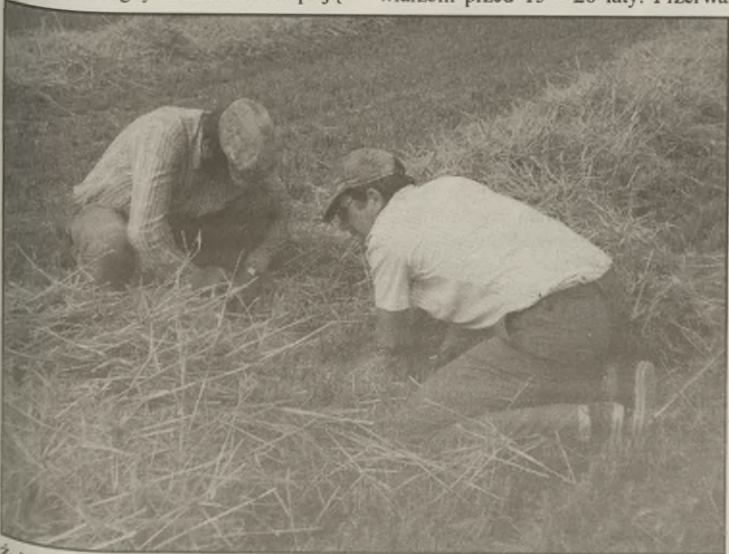
Żniwa w pełni.

obiad. Posilek przywożony jest prosto na pole z domu gospodarza. Obiad jest pożywny, ale nie ma w sobie tego posmaku rytuału jaki towarzyszył żniwiarzom przed 15 - 20 laty. Przerwa