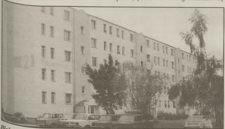
Blok przy ul. Kopernika 2