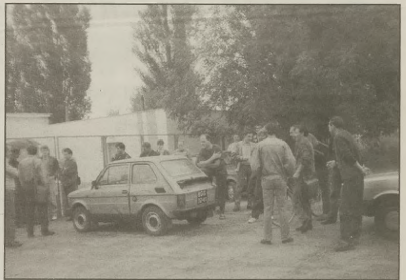
Pracownicy oczekują na wynik rozmów