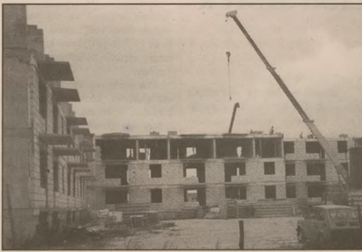
Trwają prace przy budowie II piętra bloku na Sójczym Wzgórzu.

Wszystko wskazuje na to, że nadeszły w końcu lepsze czasy dla rozgrzebanej przez Towarzystwo Budownictwa Społecznego budowy bloku przy ul. Powstańców Wlkp. na Sójczym Wzgórzu.