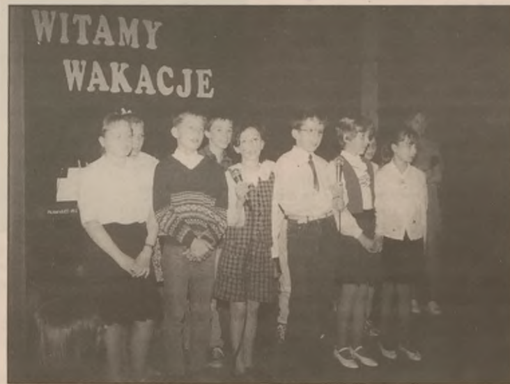
Zakończenie roku szkolnego kół zainteresowań pozalekcyjnych: uczniowie kółka języka angielskiego recytują skecz-historyjkę