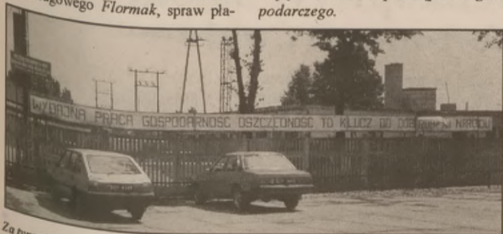
Za tym plotem z hasłem z czasów realnego socjalizmu kryły się obiekty gminnej spółki: Przedsiębiorstwa Budownictwa Ogólnego, sp. z o.o.

30 sierpnia 1995 r. skierował do Prezydium Rady Miejskiej pismo, w którym wnosil o podjęcie na najbliższej sesji Rady uchwały obligującej Zarząd Gminy do wystąpienia do delegatury NIK w Bydgoszczy, jako służby specjalistycznej, o przeprowadzenie kontroli działalności zarządu PBO Sp. z o.o. w latach 1992-1995. Radny kończył pismo słowami: Uważam, że takie rozwiązanie sprawy zakończy dyskusję i potwierdzi lub odrzuci zarządy związków zawodowych o działalności Zarządu PBO Sp. z o.o. mające znamiona przestępstwa gospodarczego.