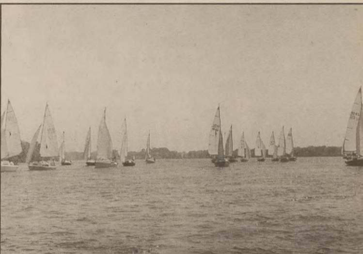
Parada jachtów na Jeziorze Czapląm

Motorowodniacy MKŻ skrupulatnie przygotowują się również do startu w zawodach żnińskich, aby godnie zaprezentować się przed własną publicznością. (aj)