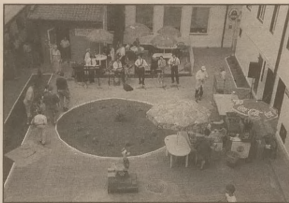
Pasaż w dniu otwarcia, widziany z drugiego piętra kamienicy przy placu Wolności 4