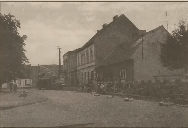
Bydgoska firma Crulex w ekspresowym tempie wykonuje prace podłączenia kanalizacji w Gąsawie. Do tej pory zostały wykonane prace na ul. L. Białego i części Rynku.