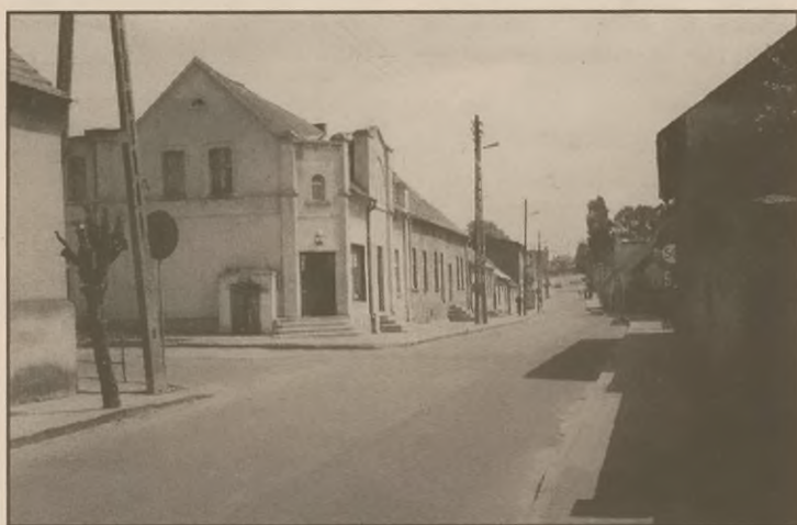
Widok na ul. św. Ducha, główną arterię Gębic.

Ostatnio pojawiły się także problemy z dojazdami do okolicznych miast. Dla przy-