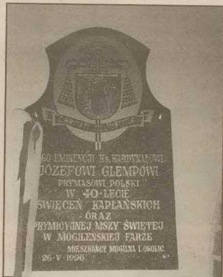
Tablica upamiętniająca 40-lecie święceń kapłańskich ks. kardynała Józefa Glempa odstonięta 26 maja w kościele św. Jakuba w Mogilnie przez szacownego jubilata