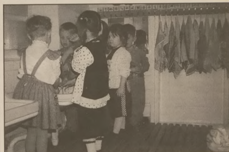
W przedszkolu wszystko dopasowane jest do wzrostu dzieci