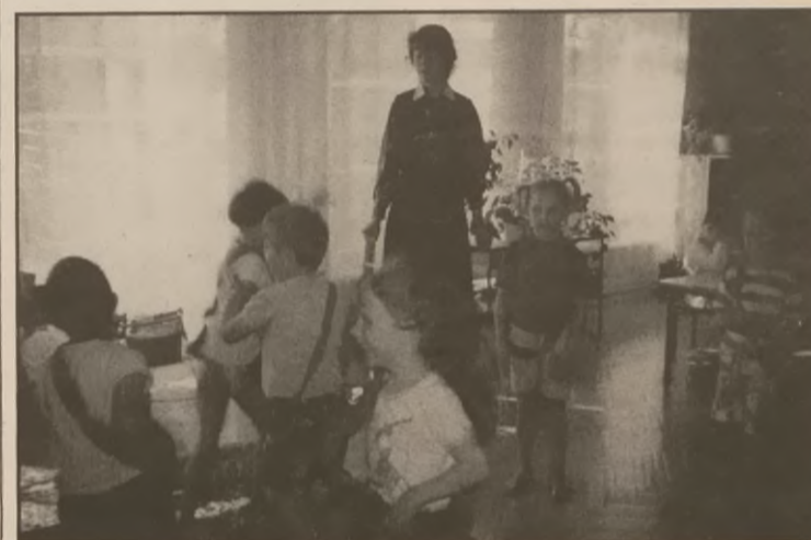
Niczym Królowa Śnieżka wśród swoich krasnoludków