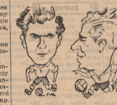
Nowak St. (Kol. Bydg.) Gronowski (Bud. Gdańsk)

Natychmiast po meczu rada trenerów ZS Kolejarz ustali reprezentację, która