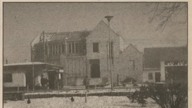
Budynek poczty i banku w Rogowie

Być może zły czas dla budowli niebawem się skończy, bowiem Centralny Zarząd Poczty, który inwestycje finansuje wraz z Rejonowym Urzędem Poczty w Bydgoszczy oraz Obwodowym Urzędem Pocztowym w Żninie czynią starania,