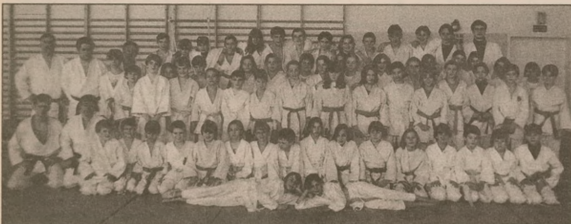
Uczestnicy zgrupowania w Mamliczu z trenerami