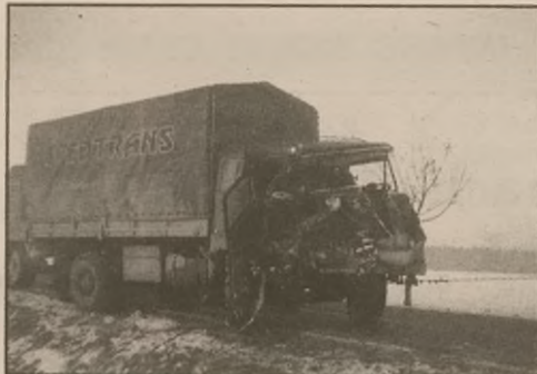
Kierowca tego jelicza uderzył o 2 w nocy 6 lutego w nieoświetlony samochód ciężarowy, stojący w Sobiejuchach na poboczu. Z opresji wyszedł cało, jego pasażerka leży w żnińskim szpitalu. Straty szacuje się na ok. 20.000 zł.

□ 1-2 lutego w Janowcu-Wsi niezamianowani sprawcy dokonali kradzieży 25 sztuk lisów