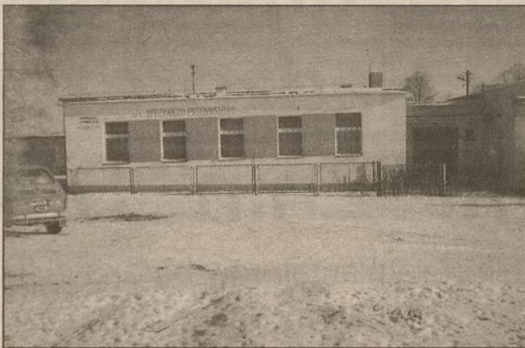
Sklep w Januszkowie. Na tablicy wiszącej po lewej stronie - szyld: spółka cywilna "Tercet". Ta część budynku jest ładnie odnowiona, część z prawej - odrapana i brudna.

Tymczasem w spółdzielni dzieją się rzeczy przedziwne. To co sprzedano za godziwą cenę (baza w Bożejowicach) nie jest zasługą likwidatora, a rolników, którzy nie zgodzili się, aby ich kosztem pokrywano długi spółdzielni.