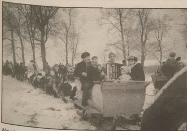
Na pierwszym zaprzęgu - kapela

Tegoroczna mroźna i śnieżna zima pozwala na kontynuowanie staropolskiego zwyczaju organizowania w czasie karnawału przejazdów saniami z muzyką i śpiewem czyli kuligów.