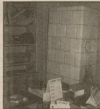
Jeden z 30 piecy szubińskiej komendy

Na terenie działania szubińskiej policji jest dwukrotnie więcej przestępstw niż w rejonie żnińskim. Jednak - jak powiedział komendant - pomimo ciężkich warunków wykrywalność ich jest duża. MARIA WARDA