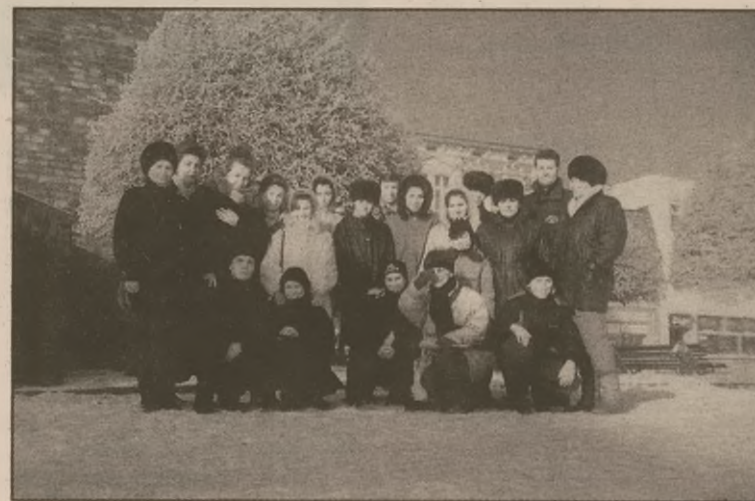
Wycieczka z Kropotkina na rynek w Żninie