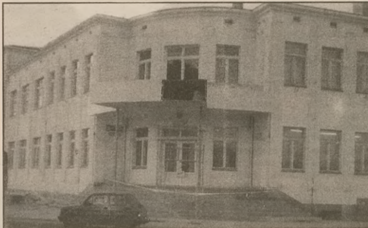
Prace dobiegają końca