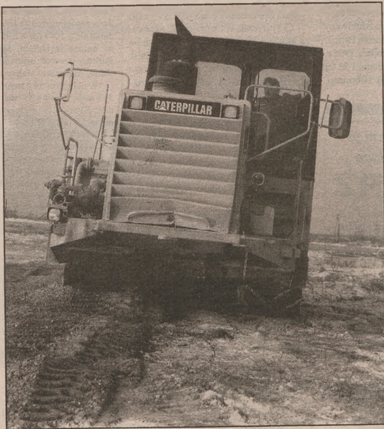
Rzadki na naszych budowach sprzęt - frezarka-mieszarka "Caterpillar" przy pracy na 16-stopniowym mrozie 24 stycznia. Pod prawym kołem widać grunt przed jej działalnością, pod lewym kołem - po. Maszyna gryzie górną warstwę ziemi, rozdrabnia ją i wyrównuje.

Podwarszawska fabryka, jak powiedział burmistrz Leszek Jakubowski, robi duże wrażenie. Zwiedzających zaskoczyła kolejka kilkudziesięciu TIR-ów oczekujących na załadunek napojów. Budowę polskiej sieci dystrybucyjnej koncernu Pepsi-Cola zakończono wcześniej niż przewidywano, można więc rozwozić napoje po całej Polsce. Dzięki temu również o rok wcześniej w Żniniu rozpoczęto budowę fabryki. Żnińska delegacja prowadziła też wstępne rozmowy dotyczące sposobów odprowadzania i ilości ścieków, które trafiają do miejskiej oczyszczalni.