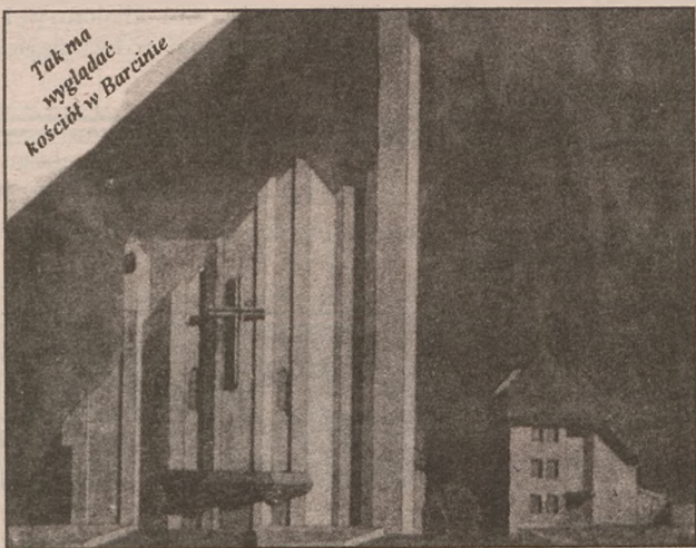
Tak ma wyglądać kościół w Barcinie

Kościół na barcińskim osiedlu budowany jest już od kilku lat. Do zrobienia pozostało wiele, między innymi wyciągnięcie murów, strop, dach, stolarka okienna i drzwiowa, instalacja elektryczna, woda i c.o. Na zakończenie spotkania Zarząd zaproponował, by ksiądz prałat wykonał dokładny kosztorys dokończenia budowy. Otrzymują go wszystkie komisje, które wypracują na jego temat swoje zdanie i przedstawiają je Zarządowi. W celu wypracowania ostatecznego stanowiska, Zarząd zaopiniuje pro-