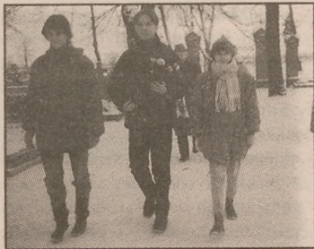
Delegacja ze Szkoły Podstawowej nr 1

Dla mieszkańców Kcyni i okolic 22 stycznia 1945 r. to pamiętna data wyzwolenia spod okupacji hitlerowskiej. W 51 rocznicę tego wydarzenia - by uczcić pamięć tych, którzy zginęli w latach 1939-45 - młodzież szkolna spotkała się w Ośrodku Kultury na