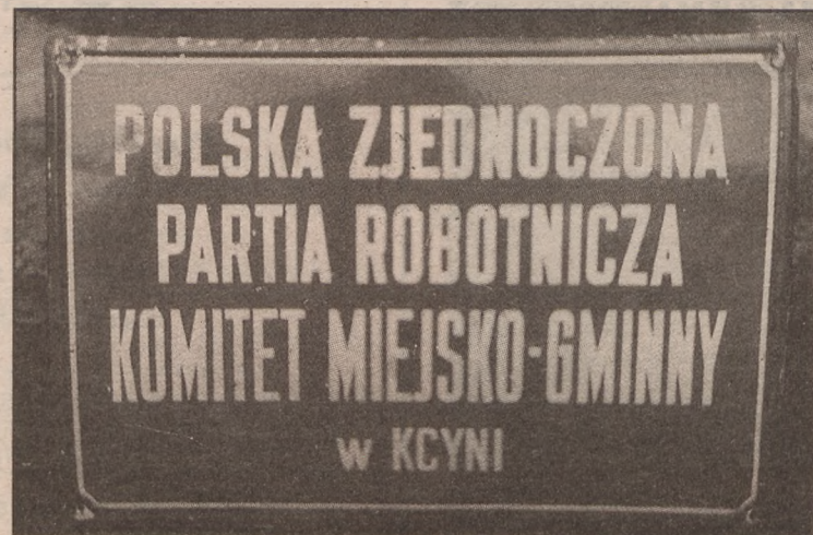
Kcynia. Zdjęcie wykonano 29 stycznia 1990 r. Tablicę usunięto w lutym 1990 r.

RYSZARD NOWICKI O następnych dziedziach Lubostroń - Arnoldzie i Melanii Skórzewskich przeczytamy w następnym numerze.