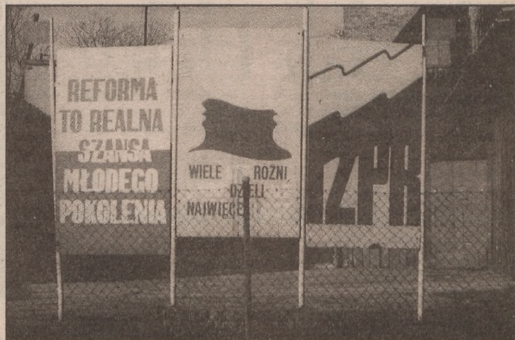
Kcynia, ul. Dworcowa - zdjęcie wykonano w listopadzie 1989 r. Tablice z hasłami usunięto w lutym 1990 r.