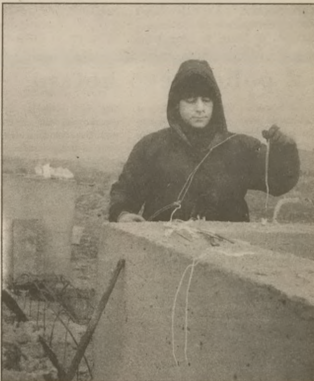
W wywiercony otwór wkłada się ładunek wybuchowy. Za chwilę w tym miejscu będzie kupka gruzu

Uroczyste otwarcie fabryki napojów w Żninie ma nastąpić 29 maja 1996 roku.