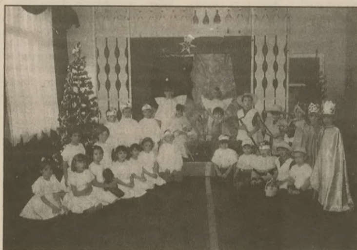
W piątek przed wigilią (22 grudnia) w Przedszkolu Miejskim nr 1 im. Marii Konopnickiej, przy ulicy Browarowej w Żninie odbyło się przedstawienie jasełkowe przygotowane przez dzieci z oddziałów IV, V, VI.

W najbliższą środę (24 stycznia) o godz. 9 15 przedstawienie to będą mogły zobaczyć dzieci z pobliskiego osiedla w wieku 3-5 lat nie uczęszczające do przedszkola. Wykonawcy zapraszają!