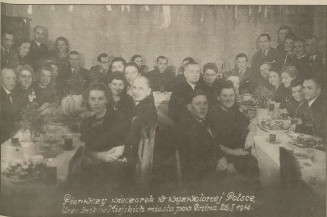
Pierwszy wieczorek w wyzwolonej Polsce, Urzędników Miejskich miasta pow. Żnina 26.I.1946.