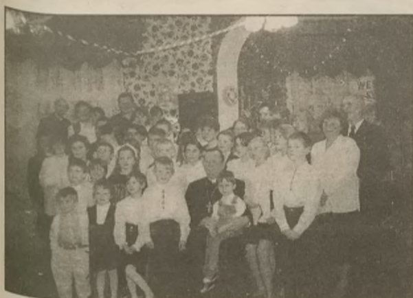
Największa rodzina w archidiecezji

Najsmutniej jest dzieciom, które dopiero trafiły do domu dziecka. Później rozumieją, że wszyscy troszczą się, aby było