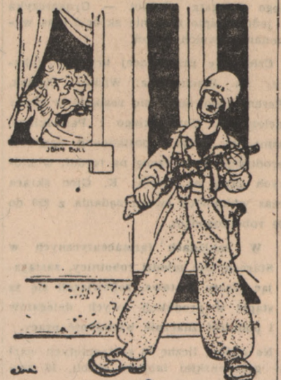
John Bull: — Teraz nie wiem. Czy ten Amerykanin broni mnie, czy też wlaściwie pilnuje?

W całym kraju na ogół dość pogodnie, tylko miejscami na północy, a zwłaszcza na Wybrzeżu i w okolicach górskich możliwe niewielkie przejściowe opady. Temperatura od 18 st. nad morzem do 24 st. na zachodzie.