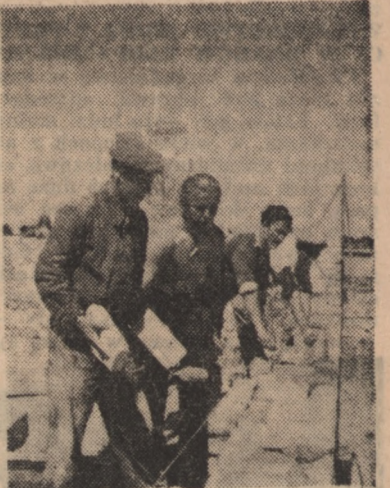
Robotnicy zatrudnieni na budowie bloków mieszkalnych dla pracowników stoczni gdańskiej we Wrzeszczu, zarówno starsi jak i młodzi, z entuzjazmem podjęli apel górnik Trzebiatowskiego. Zaciągnęli oni Wartę Złotową — podnosząc o 50 proc. swoją dotychczasową wydajność pracy.

Te słowa Prezydenta Bieruta, gorąco umiłowanego przez całą młodzież wielkiego przyjaciela, opiekuna i nauczyciela młodego pokolenia, głęboko zapadły w serca młodzieży i