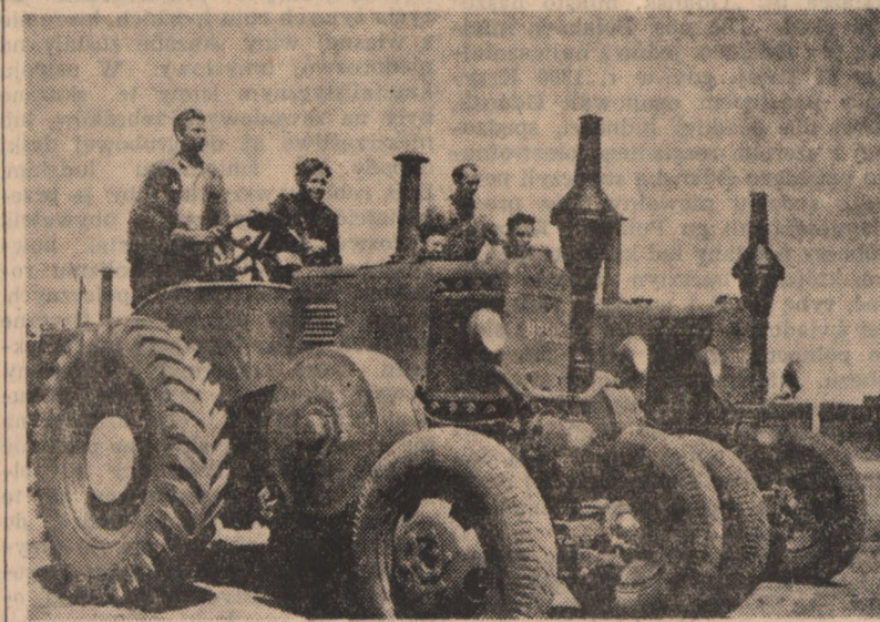
Młodzież Zakładów Mechanicznych „Ursus” w Ursusie wybrała 105 delegatów na Złot Młodych Przdowników — Budowniczych Polski Ludowej. Dla uczczenia Złotu podjęto ponad 2000 zobowiązań produkcyjnych, dających ca 680.000 zł oszczędności. Na zdjęciu: Traktory wykonane ponad plan w ramach zobowiązań zlotowych. Na traktorach tych delegaci „Ursusa” pojedą na Złot do Warszawy.

Złot Młodych Przdowników — święto młodzieży polskiej — zbiega się z innym historycznym wydarzeniem, posiadającym epokową wartość dla całego naszego narodu. Mianowicie w okresie Złotu uchwalona zostanie przez Sejm Konstytucja Polskiej Rzeczypospolitej Ludowej, wielka karta zwycięstw i osiągnięć ludu pracującego naszej Ojczyzny.