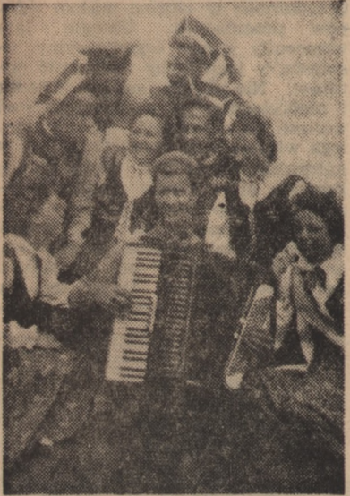
Młodzieżowe zespoły artystyczne Wybrzeża przygotowują się do występów w czasie Złotu Młodych Przdowników — Budowniczych Polski Ludowej. Na zdjęciu: Członkowie zespołu ZPGG z Nowego Portu śpiewają piosenki z którymi wystąpią na Zlocie.

Ku dziewięciu dworcem Wielkiej Warszawy wyruszyły z całej Polski pociągi zlotowe, wiozące delegatów polskiej młodzieży, tych, którzy wynikami osiągniętymi w pracy i nauce zasłużyli sobie na największy zaszczyt: na prawo uczestniczenia w