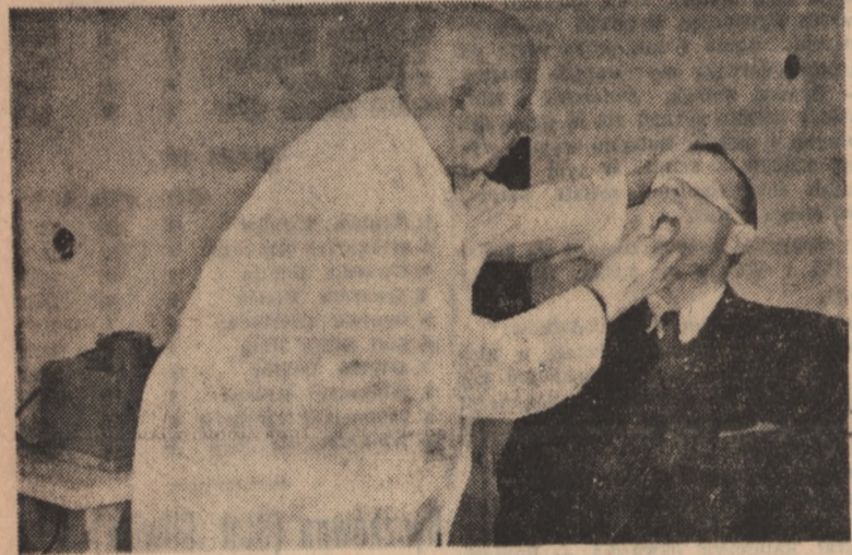
Alkoholizm to choroba, a chorobę trzeba leczyć. W Woj. Poradni Psychiatrycznej w Bydgoszczy — dr. Miedziszewski w czasie badania pacjenta.