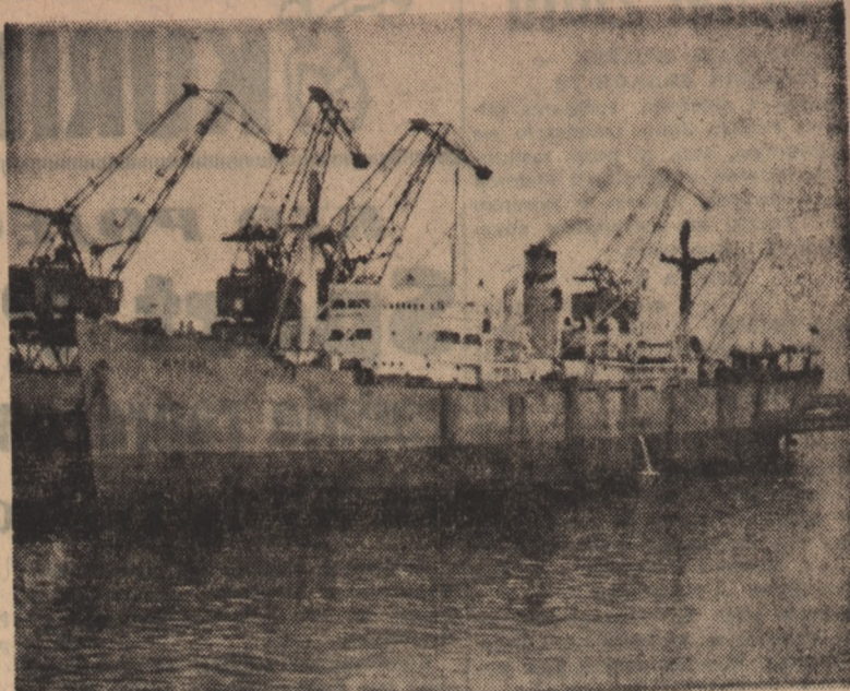
Polskie Linie Oceaniczne wykonały w dniu 24 czerwca br. półroczny plan przewozów.

Do jednego z pierwszych statków, które wykonały plan przed terminem należy statek „Bytom”.