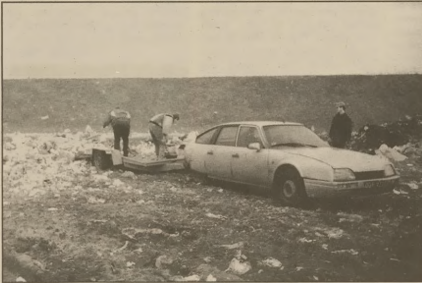
Na wysypisku w Wawrzynkach

Fundacja zamierza zbudować szlaki rowerowe służące do komunikacji i rekreacji mieszkańcom gminy i turystom. Planuje się także włączenie ich do krajowej i zagranicznej sieci dróg rowerowych (na przykład do realizowanego już programu drogi rowerowej Frankfurt nad Odrą - Biskupin).