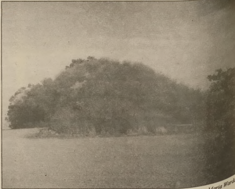
Kurhan w Czewujewie