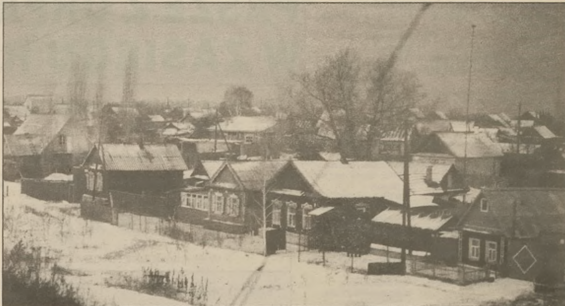
Tak mieszkają Polacy w Kazachstanie

lkie, że nie czekali na architektów, którzy powiedzieliby im jak budować. Na oko odmierzali krokami przestrzeń która, jak im się wydawało,