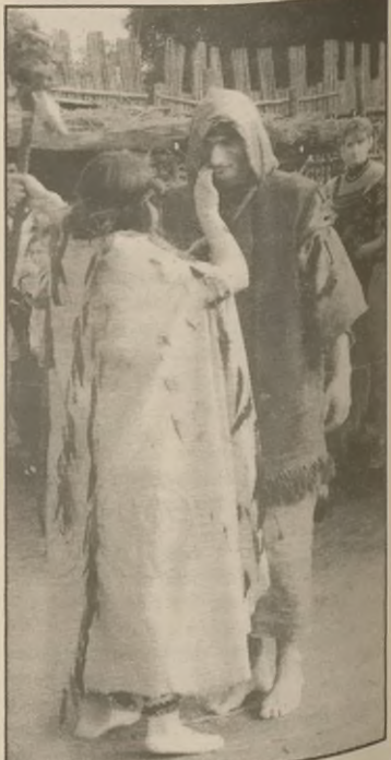
Szaman i wróżka odprawiają czary.

Symbolem zawarcia związku małżeńskiego była wymiana noszonych na głowie wieńcy swadźebnych i podpisanie dokumentu swadźby. Młodym odśpiewano znane: Oj chmielu, chmie-