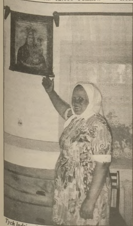
Tych ludzi podtrzymywała wiara

zamieszkujących Azję Środkową - oprócz zesłańców byli to także emigranci zarobkowi z Królestwa z przełomu XIX i XX wieku. Część z nich wróciła do kraju na podstawie polsko-rosyjskiego układu o repatriacji z roku 1921. Przed rokiem 1936 Kazachstan zamieszkiwało zapewne nie więcej niż 5000 Polaków