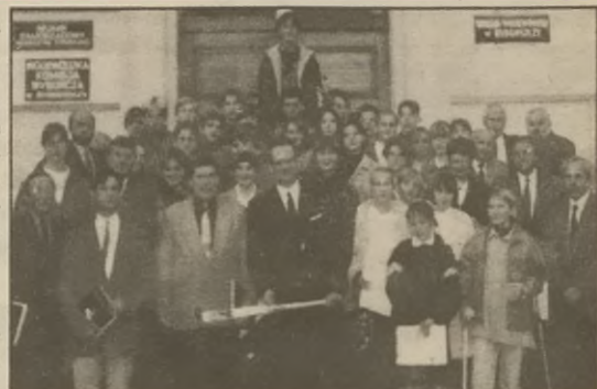
Laskarze z Gąsawy i Żnina wraz z działaczami sportowymi i wojewodą na schodach Urzędu Wojewódzkiego w Bydgoszczy.