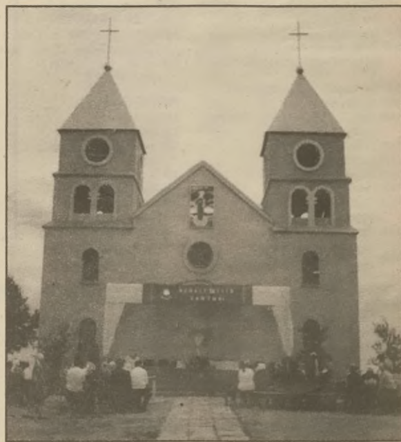
Kościół w Oziernoje

ściej nigdy w Polsce nie mieszkali - ich ziemia była Ukraina. Później, już na zsyłce, do codzienności należały małżeństwa mieszane, dlatego z tymi wyjazdami jest różnie. Starsi mówią: Tu jest nasza ziemia, tu się urodziłem. Czemu pojedziemy tam szukać? Młodzi owszem, chcą wyjechać, jednak dla nich jest to przygoda. Traktują Polskę jak bogaty Zachód i bycie