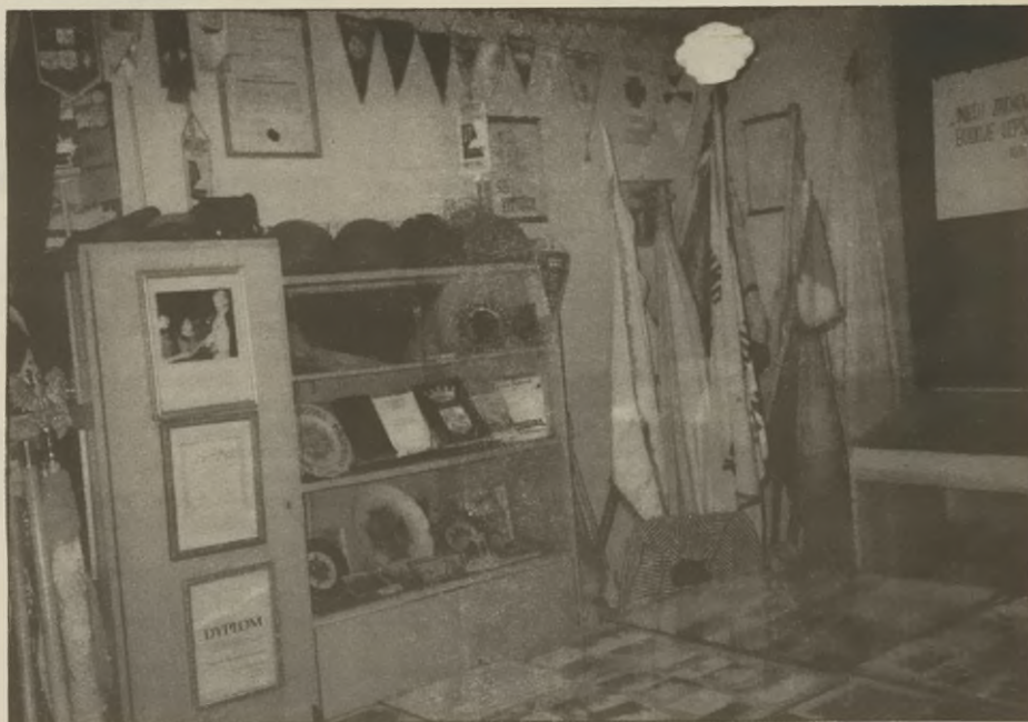
Fragment wnętrza Muzeum Ziemi Szubińskiej w Szubinie.

Przez minione dwa lata w muzeum zorganizowano 13 wystaw okolicznościowych, które odwiedziło ponad 5 tysięcy osób nie tylko z Szubina, ale z całej Polski oraz różnych krajów Europy i Ameryki, a nawet Afryki. Największą frekwencją zwiedzających cieszyły się wystawy: "200 lat poczty w Szubinie i na Pałukach" (650 zwiedzających), "Powstanie Wielkopolskie" (650 zwiedzających), Auschwitz-Birkenau - otchłań męki i śmierci" (620 zwiedzających), "Kolekcjonerstwo" (580), "Miejsca Pamięci Narodowej" (410).