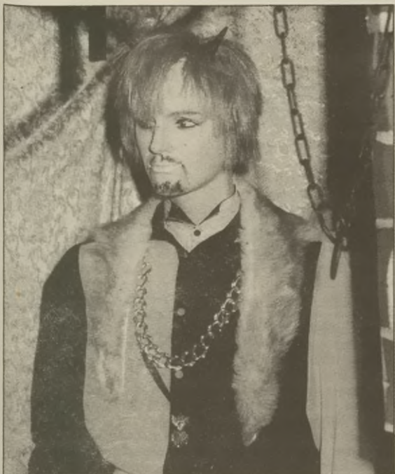
Diabeł Wenecki - manekin wyobrażający postać groźnego feudała.