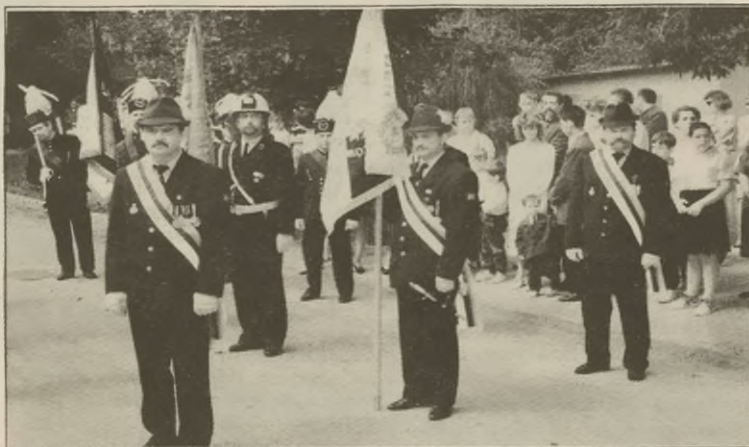
Poczet sztabowy Piechcińskiego Bractwa Kurkowego