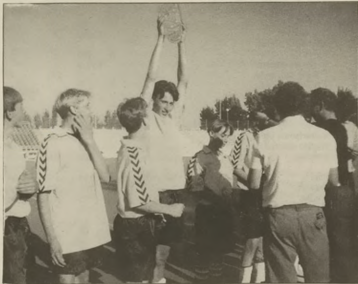
Wręczanie złotych medali i pucharu

Wszystkie mecze sędziowane były bardzo dobrze przez zawodowych sędziów.