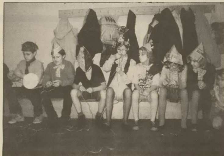
Dzieciom w Krainie Uśmiechu pomysłów na dobrą zabawę nie brakuje.

myślów na dobrą zabawę nigdy nie brakuje. Teraz przygotowują się do poważnego letniego zadania. Postanowili