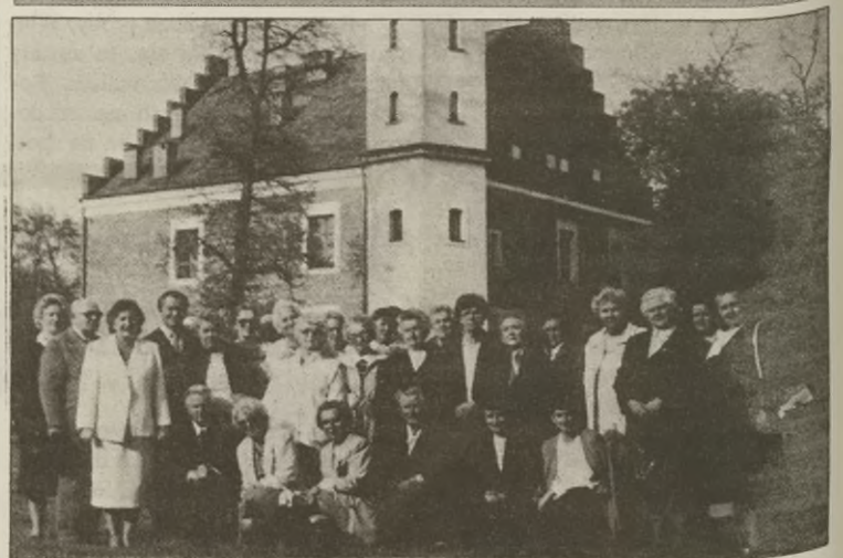
4 maja członkowie Kcyńskiego Towarzystwa Kulturalnego spotkali się na majówce w zamku w Grocholnie. Była kawka, ciasto, konkursy, no i tańce, jak na majówce przystało. Pogoda i humory dopisywały.