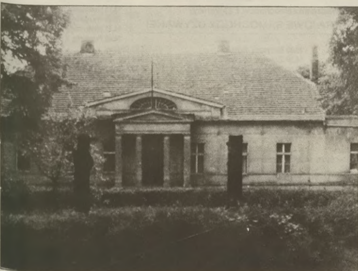
Dworek (wójtostwo) z końca XVIII wieku, dziś siedziba Ośrodka Kultury.

Z II połowy XIX wieku mamy w Kcyni znacznych rozmiarów budowle: byłego Seminarium Nauczycielskiego (dziś Zakład Poprawczy) z lat 1860-1865; poczty keyńskiej z 1867 roku; byłego Sądu Grodzkiego, dziś przedszkola, z 1880 roku; rzeźni miejskiej z 1894 roku. Obok budowli imponujących wielkością przy takich ulicach jak Szewska, Ogrodowa, Sądowa, Poznańska, Dworcowa, Okrężna, Libelta współczesna Kcynia ma kilkanaście parterowych zabytkowych budynków mieszkalnych z ubiegłego stulecia. Do ciekawych należy dom przy Szewskiej 11 z charakterystycznym