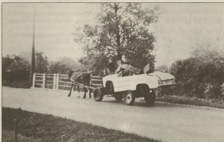
Syrena z napędem na cztery kopyta