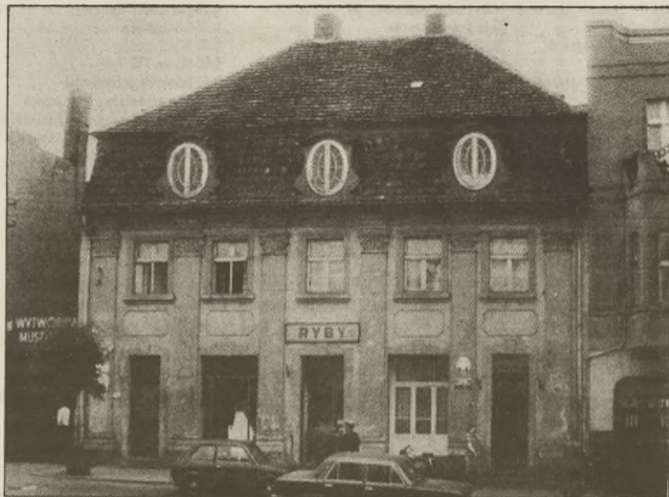
Kamienica z końca XVIII wieku w Rynku (nr 14). Najstarszy mieszczański obiekt świecki w Kcyni.

W 1787 roku zakończono odbudowę murowanego barokowego kościoła i klasztoru karmelitów - zakonników sprowadzonych do Kcyni w 1612 roku. Na kalwarii malowidła ściennie wykonywał prawdopodobnie artysta