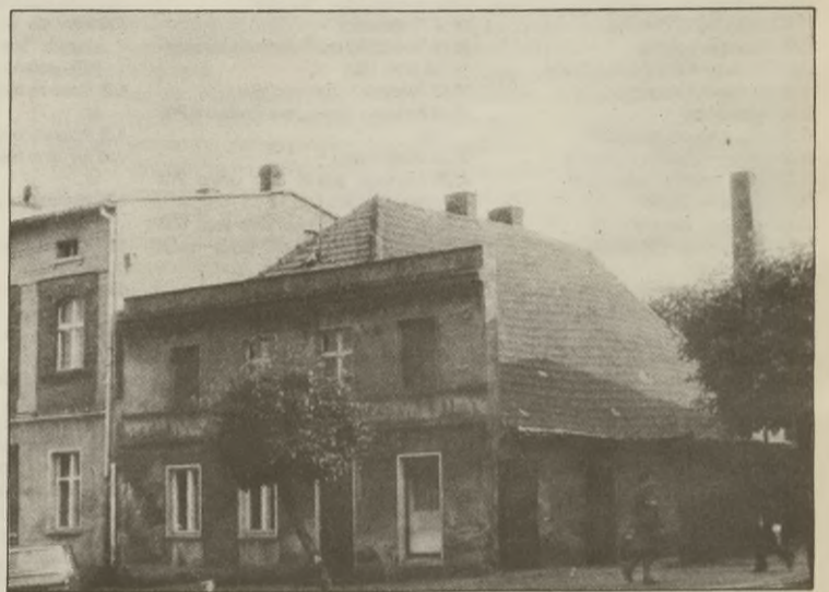
Rynek 7. Ten o spadzistym dachu budynek uzmysławia nam, jaka zabudowę miała Kcynia z końcem XVIII wieku.