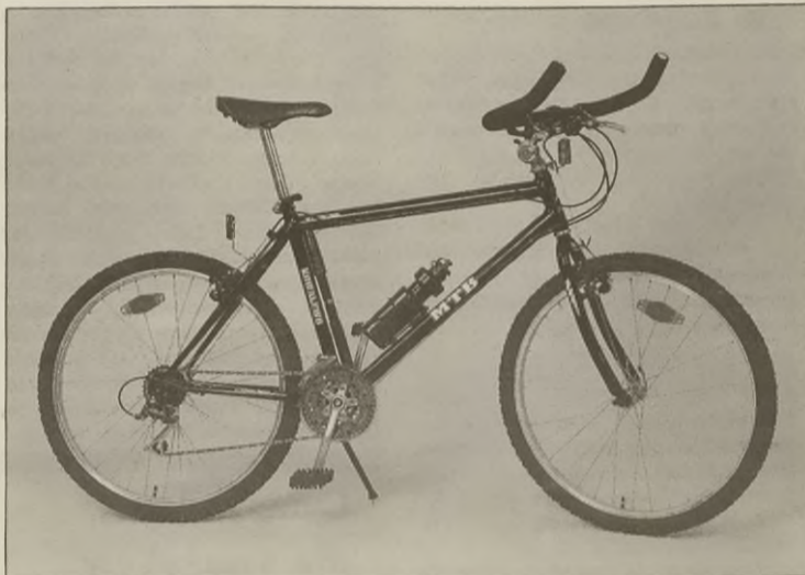
Laureat piątej edycji konkursu "Teraz Polska" - "Wezuwiusz Super" wymyślony i wyprodukowany w Zakładzie Rowerowym Romet S.A. w Kowalewie Wielkopolskim.

ne kilkutygodniowej ocenie ekspertów w komisjach branżowych. Dokonano oceny jakościowej, handlowej i wzorniczej. Spośród nich Kapituła Polskiego Godła Promocyjnego 28 kwietnia wyłoniła 15 laureatów. Wśród nich znalazł się rower terenowy Wezuwiusz Super , produkowany przez Zakład Rowerowy Romet S.A. w Kowalewie Wlkp.