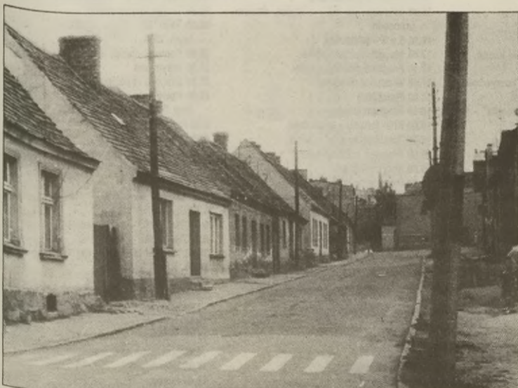
Widok na XIX-wieczne parterowe domki przy ul. Szewskiej.

Na tzw. wójtostwie przy ulicy Libelta w parku, gdzie dziś swą siedzibę ma MGOK, jest dworek z I połowy minionego wieku. Jego właścicielami był hrabia Itzenplitz, a w okresie międzywojennym Złotowicz, do któ-