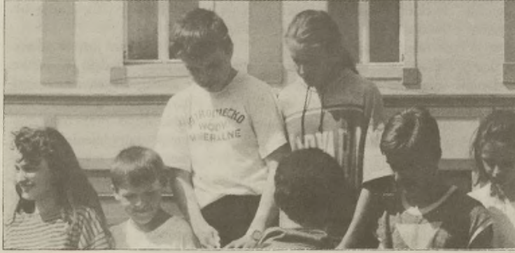
Zwycięzcy biegu klas I-VI na podium