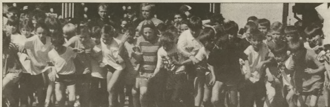
Start biegu klas III-IV

Nie mniejsze emocje były podczas biegu klas III i IV na 600 m, podczas którego doszło nawet do wywrotki kilku zawodników. Pozbierali się jednak i pobiegli dalej. W tej kategorii