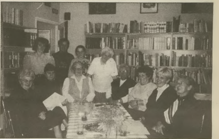
Mistrzynie igły z Łabiszyna