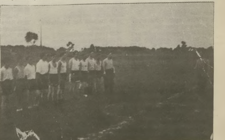
Reprezentacja Armii Radzieckiej przed meczem ze "Zrywem" Kcynia