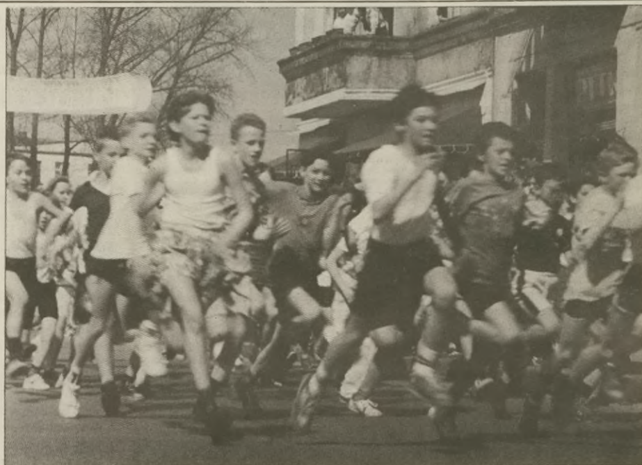
Na zdjęciu - start biegu na kilometr klas V-VI (na stronie 7 - sprawozdanie z III Ogólnopolskich Biegów Żnińskich)

na s. 4 - sprawozdanie Komisji Rewizyjnej i dalsza część sesji.