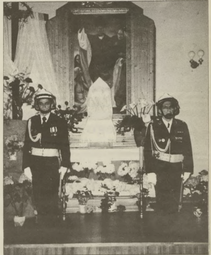
Zakończył się Wielki Tydzień, minęły Święta Wielkiej Nocy. Na zdjęciu - strażacy z Rynarzewa pełnią wartę przy Grobie Chrystusa.