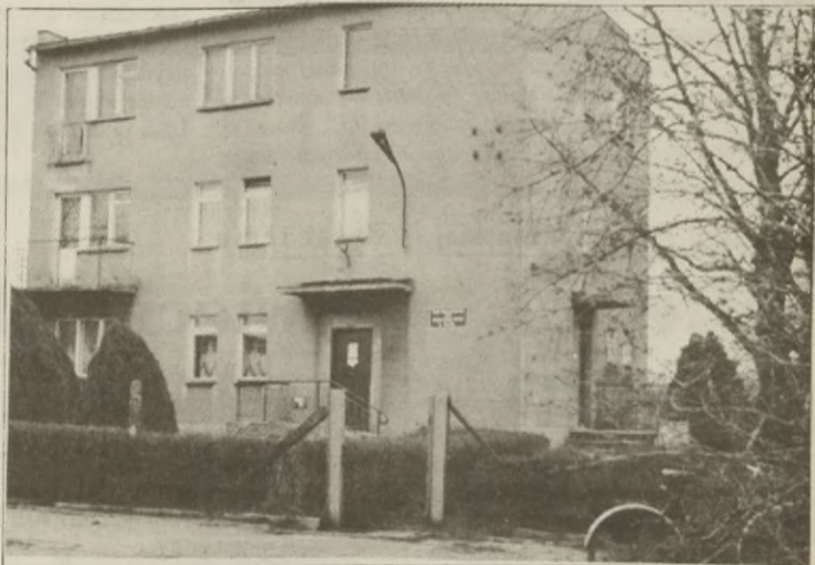
Wiejski Ośrodek Zdrowia w Żarczynie (gmina Kcyńsk) należący do ZOZ w Żninie. Na II piętrze wolne 3-pokojowe mieszkanie.

remontu budynku przychodni rejonowej (budynek oddano w 1978 r.), gdzie stwierdzono pęknięcia ścian; konieczność poprawy usług stomatologicznych, szczególnie dla dzieci i młodzieży zarówno na wsi, jak i w mieście; potrzeba wydłużenia czasu pracy, szczególnie Przychodni Rejonowej w Kcyńsku; potrzeba uregulowania przynależności wiejskiego ośrodka zdrowia w Żarczynie (gm. Kcyńsk) podlegającego ZOZ w Żninie; konieczność pozyskania na tak rozległą