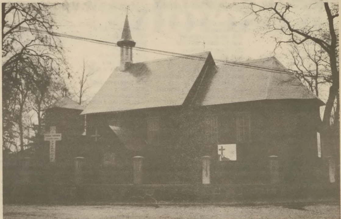
Kościół w Gąsawie

dziesięciu siedmiu, siedemdziesiąt trzy to kościoły parafialne, a pozostałe to pomocnicze. Dwa kościoły, w Zrazimiu i Łeknie - poniemieckie, są nieczynne.