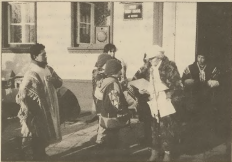
Dyrektor M-GOK wręcza nagrody laureatom konkursu na szopkę w obecności przygrywającego zespołu z Peru. W głębi wystawa szopek.