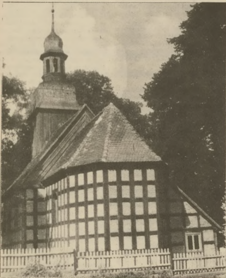
Jaktorowo koło Golańcu. Kościół parafialny pw. św. Anny fundowany i poświęcony w 1776 r., o konstrukcji szachulcowej, barokowe wyposażenie wnętrza.