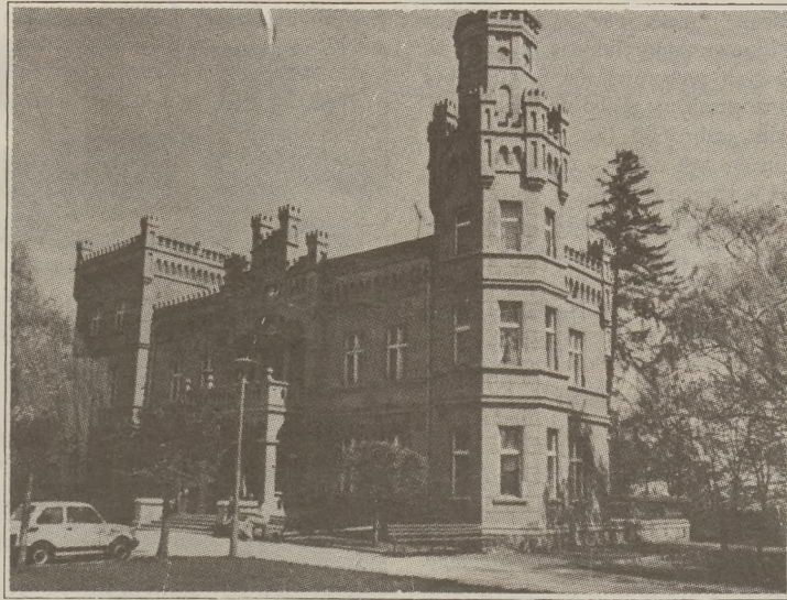
Budynek Domu Dziecka w Kołdrąbii