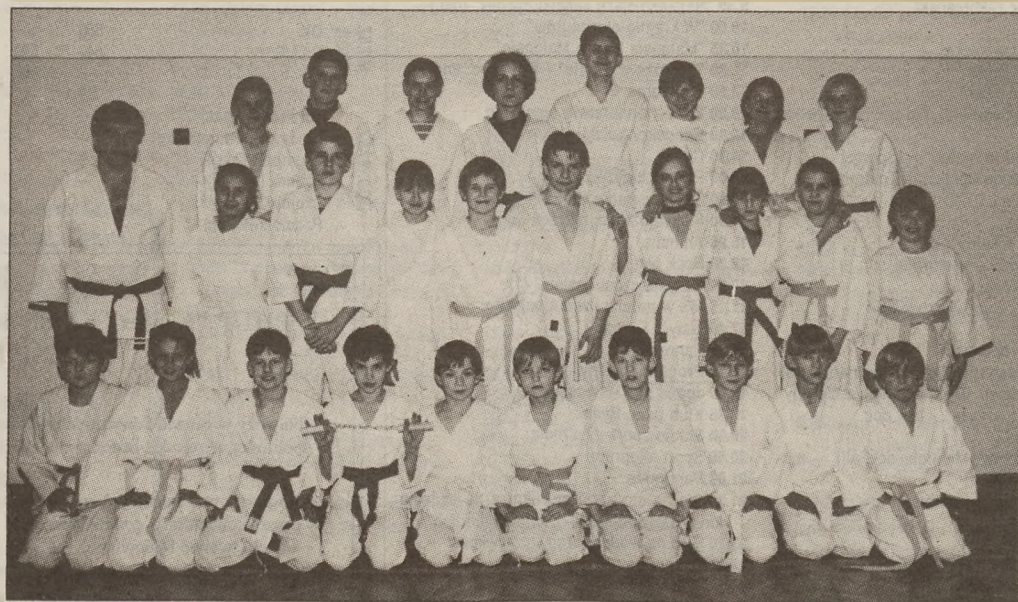
W Barcinie też trenują judo. Na zdjęciu sekcja Miejskiego Ośrodka Sportu i Rekreacji.

3 lutego w XI kolejce zmierzą się: PKS - Kamerun (0:2), Szelejewo - Barcelona (1:5), Cukrownia - Pałuczanka (2:2), Taxi - Pol-Tusz (2:1). Początek godz. 19 15 . (kl)