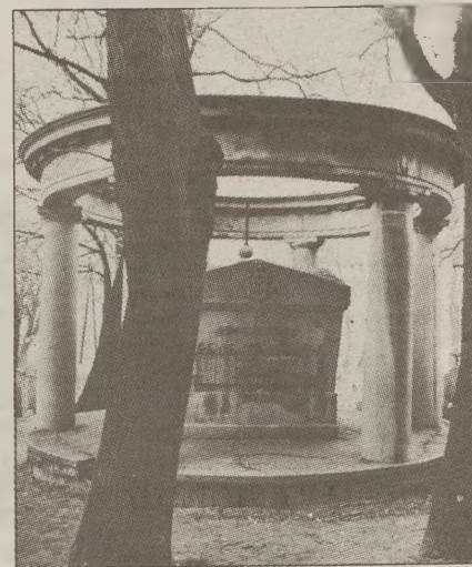
Grobowiec Czarlińskich na cmentarzu w Rogowie.