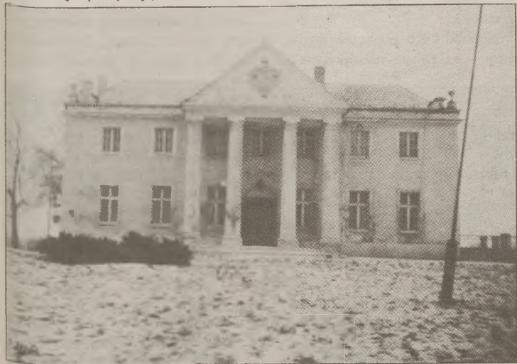
Pałacyk w Grochowskich Szlacheckich.

Niestety, nie mogłam jej nie powiedzieć. Po tej wizycie doznałam uczucia trwogi. Przecież to straszne, że u progu XXI wieku pomieszczenie, gdzie przyszło żyć choremu dziecku i jego bezsilnej babci, przypomina XIX-wieczną suterennę. Nie wierzę, że nie można zapewnić godziwych warunków mieszkaniowych tej rodzinie. Im potrzebna jest łazienka i ogrzewanie. W takim przypadku mówienie o zbyt dużych kosztach utrzymania to, moim zdaniem, nietakt. Przecież miarą naszego