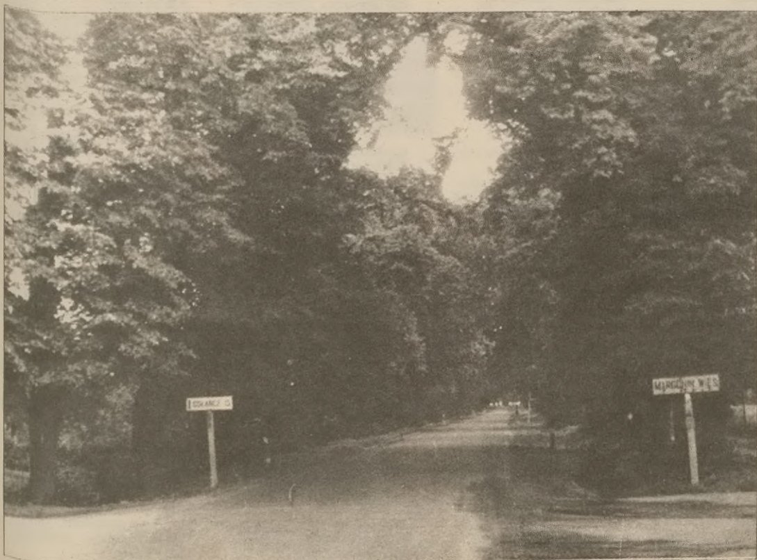
Skrzyżowanie dróg w Margonińskiej Wsi