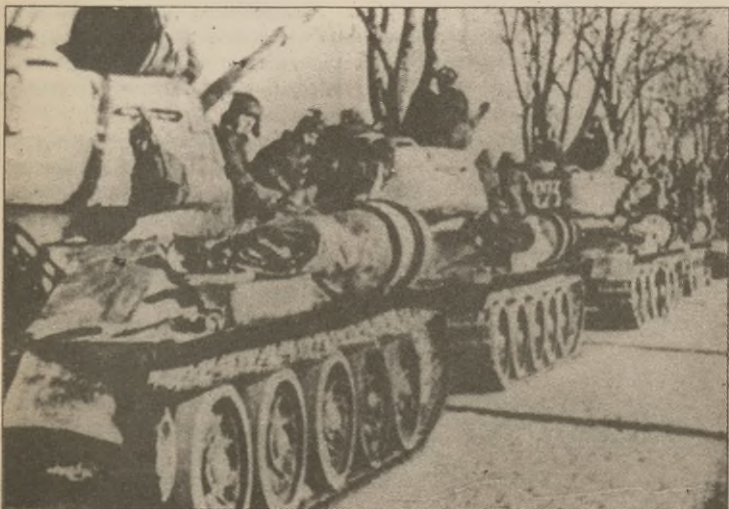
Styczeń 1945 r., czołgi radzieckie.