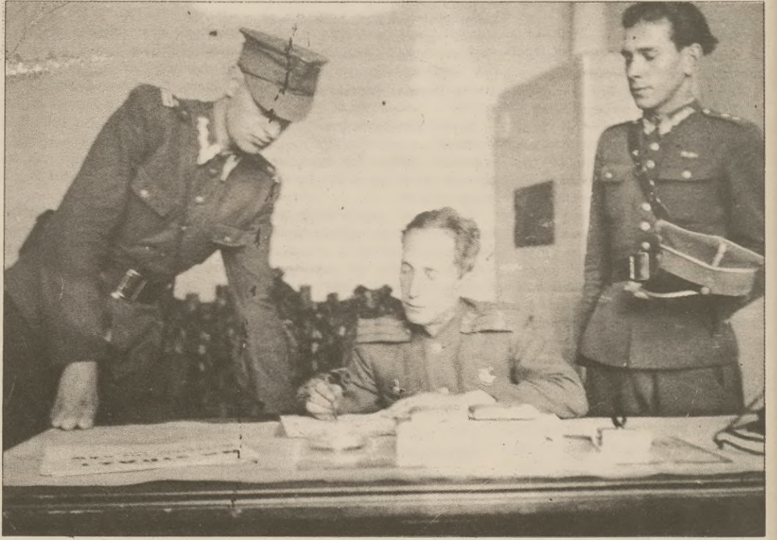
Styczeń - luty 1945 r. Siedziba sztabu w pałacu Tupadły koło Keyni. Oficer radziecki (w środku) z oficerami polskimi.