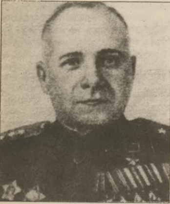
General płk Siemion Bogdanow (1894-1960), dowódca 2 Armii Pancerniej Uderzeniowej 1 Frontu Białoruskiego. Jego oddziały i pododdziały wyzwoliły Pałuki w dniach 21-24 stycznia 1945 r.

12 stycznia 1945 r. po kilkumiesięcznej przerwie ruszyła spod przyczółka sandomierskiego wielka operacja wiślańsko-odrzańska 1 Frontu Białoruskiego wojsk radzieckich. Z początkiem trzeciej dekady stycznia pierwsze oddziały 2 Armii Pancerniej Gwardii generała płk. Siemiona Bogdanowa wkroczyły na Pałuki.