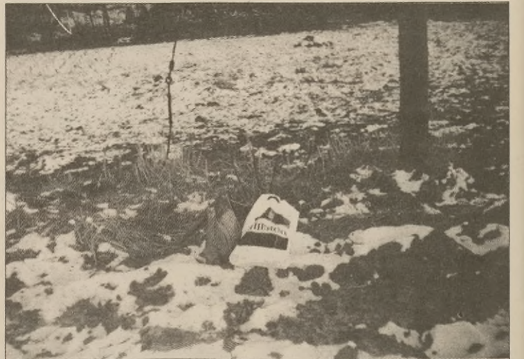
Miejsce, w którym zagrzebano zwłoki niemieckich żołnierzy, zamordowanych w piwnicach banku w Rogowie. Ich kości spoczywają podobno metr nad ziemią, w miejscu oznaczonym torebką i foliową torbą.

Według pani Mikulskiej strzały, które słychać było od strony trzcin, pochodziły od innej grupy uciekinierów. Około 24 żołnierzy niemieckich uciekało nad jeziorem tą stroną, którą nie szli Rosjanie. Z tej grupy oderwało się dwóch mężczyzn; zostali zabici na niemieckim cmentarzu. Ludziami, którzy wykonali rozkaz rozstrzelania, rodzina żołnierza prosiącego o darowanie życia wytoczyła proces w sądzie w Żninie. Dalszego ciągu nie znam.