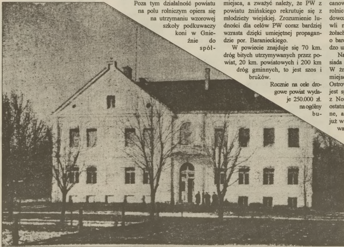
Przedwojenny wygląd budynku starostwa przy ulicy Potockiego, obecnie siedziba Urzędu Rejonowego.

Poza tym działalność powiatu na polu rolniczym opiera się na utrzymaniu wzorowej szkoły podkuwaczy koni w Gnieźnie do spół-