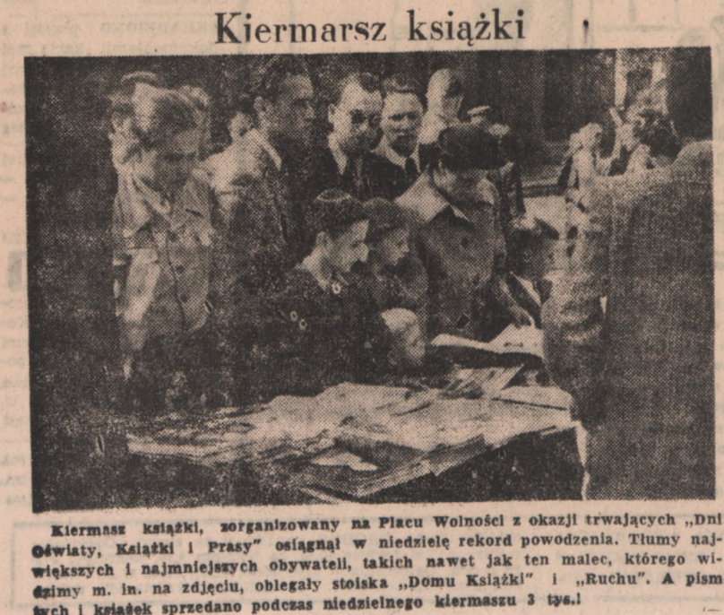
Kiermasz książki, zorganizowany na Placu Wolności z okazji trwających „Dni Oświaty, Książki i Prasy” osiągnął w niedzielę rekord powodzenia. Tłumy największych i najmniejszych obywateli, takich nawet jak ten malec, którego widzimy m. in. na zdjęciu, obiegaly stoiska „Domu Książki” i „Ruchu”. A pism tych i książek sprzedano podczas niedzielnej kiermaszu 3 tys.!