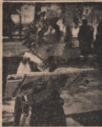
W dniu 4 maja br. w wielu punktach otwarto kiermasze książek i prasy, cieszące się dużą frekwencją wśród mieszkańców stolicy.

Na zdjęciu: Fragment kiermaszu na Alei Stalina.