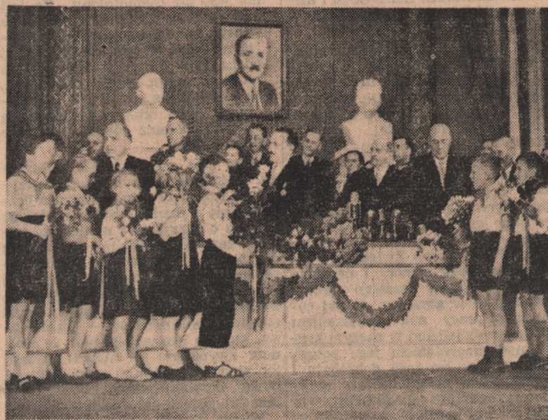
18 kwietnia br. w 60 rocznicę urodzin Przewodniczącego KC PZPR Prezydenta RP Bolesława Bieruta odbyła się w Teatrze Polskim w Warszawie uroczysta Akademia zorganizowana przez Komitet Centralny PZPR. Na zdjęciu: Delegacja dzieci, która złożyła Prezydentowi życzenia urodzinowe.

Przemówienie Premiera J. Cyrankiewicza z okazji siódmej rocznicy polsko-radzieckiego układu o przyjaźni