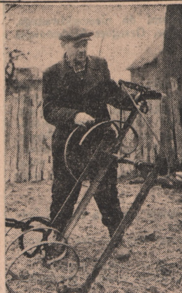
W przededniu 60 rocznicy urodzin Prezydenta RP Bolesława Bieruta i Święta 1 Maja w wielu gromadach chłopów zakładają nowe spółdzielnie produkcyjne

Jak wynika z tych meldunków, kampania siewna znajduje się obecnie w szczytowym punkcie swego nasilenia.