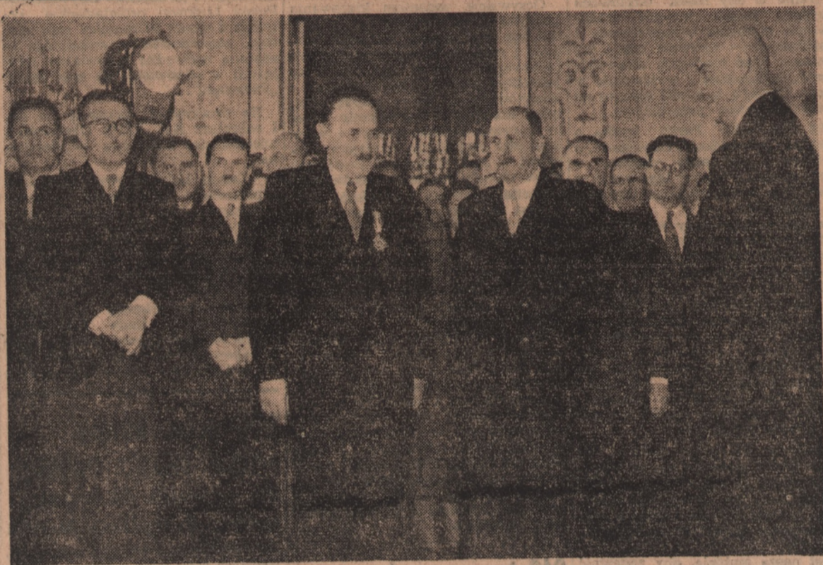
W dniu 17. IV. 1952 r. Marszałek Sejmu Wł. Kowalski dokonał dekoracji Prezydenta Bolesława Bieruta Orderem Budowniczych Polski Ludowej.