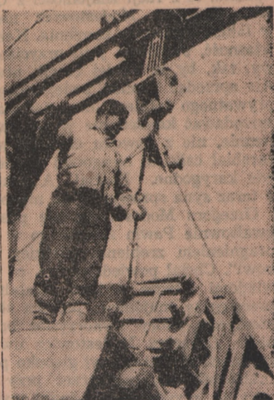
Przy budowie Cementowni w Wierzbicy trwają gorączkowe prace przed mającym się odbyć uruchomieniem wielkiego obiektu Piłnu 6-letniego.