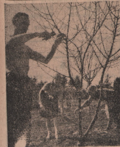
Prace wiosenne w ogródkach działkowych są już w pełnym toku.

Serdeczne słowa Wielkiego Stalina, Chorażego Pokoju i przyjaciela narodu polskiego będą dla nas nowym bodźcem do wzmocnienia pracy na rzecz pogłębienia i umocnienia przyjaźni narodu polskiego i narodów Związku Radzieckiego. Pod kierownictwem towarzysza Bieruta, wiernego ucznia Lenina i Stalina poświęcimy wszystkie nasze siły budownictwu Polski Socjalistycznej i sprawie pokoju między narodami.