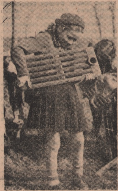
Młodzież szkolna bierze czynny udział w ogólnej akcji zbiórki złomu, która w całym kraju rozpoczęła się 15 bm. i trwać będzie do końca czerwca br.

Państwowe Teatry Dramatyczne wystawią sztukę Romana Brandstaettera „Król i aktor”. Teatr Kolejowy — „Popas Króla Jędrzejki”. A. Grzymały-Siedleckiego; Teatr Młodego Widza — sztukę Morstina poświęconą Miłkożajowi Rejowi pt. „Poliacy nie gęsi”.