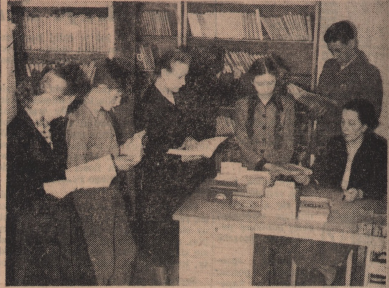
Ogólnokształcąca Szkoła TPD im. Bolesława Bieruta w Orłowie otrzymała w darze od Prezydenta R. P. ponad 300 tomów nowych, wydawnictw książkowych dla swojej biblioteki.

Na zdjęciu: W szkolnej bibliotece młodzież przegląda książki otrzymane od Prezydenta.