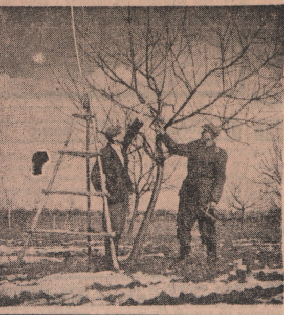
Załoga zespołu Państwowych Gospodarstw Rolnych Kock w pow. Łukowskim przoduje w wykonaniu planów produkcyjnych.

Nie, nie, nie. A może w San Marino? Może zamówienie takie może przyjąć Andorra? Amerykańscy kondotierzy kapitału widzą, że gdziekolwiek się obróca, wszędzie narody spoglądają z nadzieją na partie komunistyczne, na najbardziej nieugiętych szermierzach wolności ludów — komunistów. Więc drżą o dolary swoich macedawców, o los produkowanej broni, własne prowizje, o własne skóry. A czym się taki lek kończy, to już wiódziliśmy: u pewnego ministra wojny USA nazwiskiem Forrestal. Najpewniejszym środkiem jest okratowanie okien i antyatomowe kaftany bezpieczeństwa, które w pomyslowej Ameryce znajdują się chyba wśród antyatomowych szczoteczki do zębów i kapeluszy.