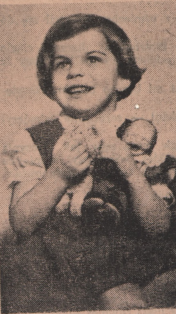
„Szczęśliwe i radosne jest dzieciństwo naszych najmłodszych obywateli.”