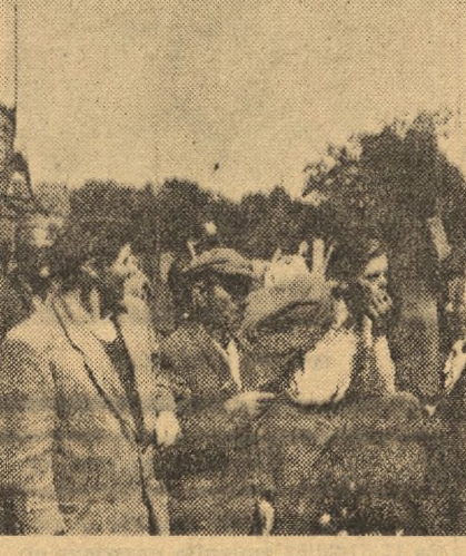
Przed złożeniem zboża do magazynu GS jest czas na pożyteczne rozmowy. Np. w Łoskoniu jeszcze w malej mierze uprawia się buraki cukrowe. A od jesieni, kiedy już często ziemi obejmą wspólną gospodarkę — warto o tym pomyśleć.

miki Budowlanej, których ekipa łączności w niejednym pomogła już gospodarzom z Łoskonia. Wspólnie przygotowali zboże dla Państwa robotnicy i chłopci.