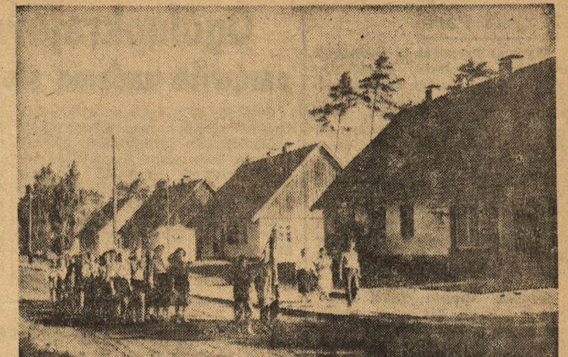
W Podgrodziu koło Szczecina powstało miasteczko dziecięce. Miasteczko dzieli się na cztery dzielnice...