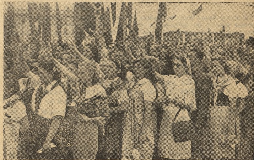
Olbrymia manifestacja młodzieży na Placu Zwycęstwa w Warszawie. Młodzież składa uroczyste ślubowanie.