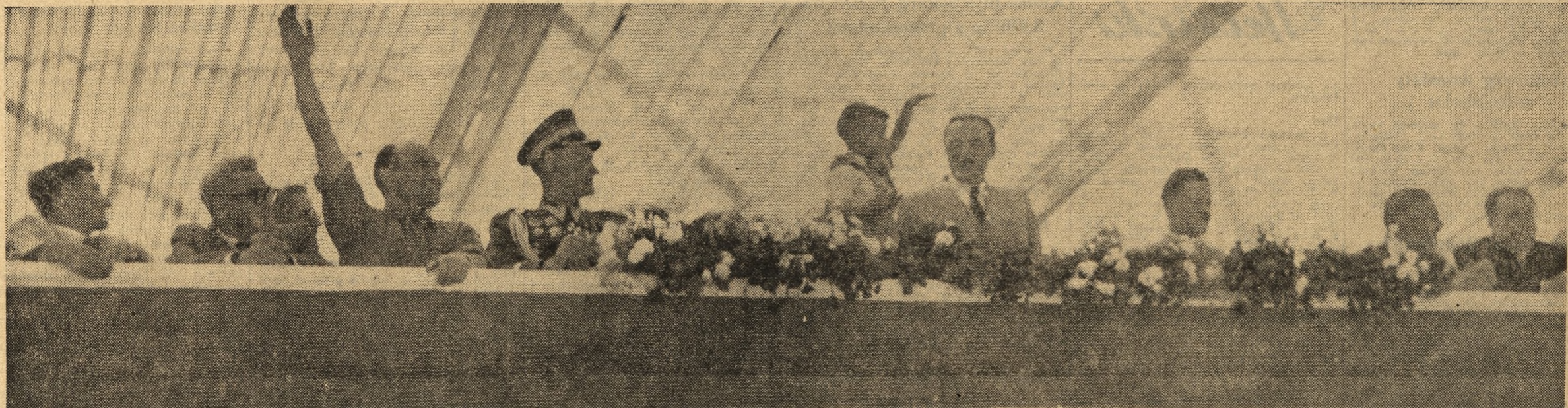
W dniu Święta Odrodzenia na Placu Konstytucji w Warszawie odbyła się wspaniała defluda 200 tysięcy Młodych Przewodników — Budowniczych Polski Ludowej. NA ZDJĘCIU: Trybuna honorowa.

Na przyjęciu obecni byli członkowie Korpusu Dyplomatycznego. Obecni byli również członkowie delegacji zagranicznych przybyłych na Zlot.