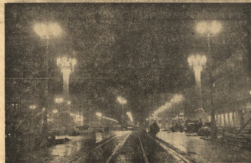
Plac Konstytucji w nocy.