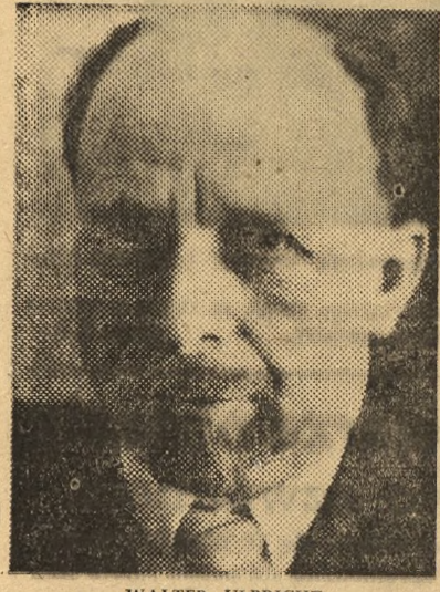
WALTER ULBRICHT wicepremier NRD

BERLIN (PAP). Na II Konferencji Niemieckiej Socjalistycznej Partii Jedności (SED), sekretarz generalny SED, W. Ulbricht, wygłosił referat pt. „Sytuacja obecna a nowe zadania Niemieckiej Socjalistycznej Partii Jedności”.