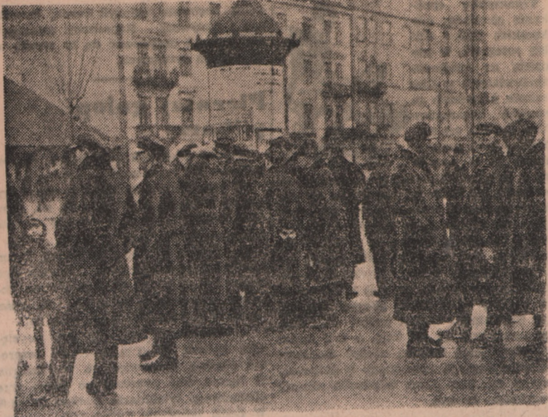
Strajk tramwajarzy w Warszawie w 1936 roku. Grupki strajkujących pracowników tramwajowych koło wozowni na Woli.