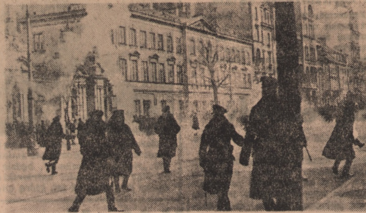
RAZEM Z BURŻUAZJĄ — PRZECIWIW LUDOWI

„Praworządność obecnego okresu — swolm ostrzem wymierzona jest przeciwko wrogom pokoju i niepodległości Ojczyzny, przeciwko złodziejom i szkodnikom w gospodarce narodowej, przeciwko chuliganom i trwoniaczom własności społecznej, przeciwko tym oby-