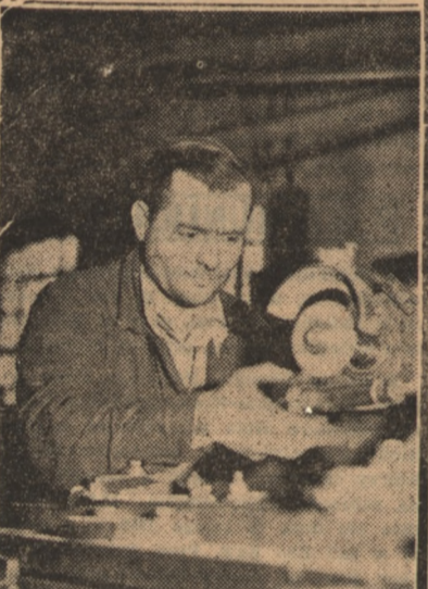
Załoga zakładów im. 1 Maja w Pruszkowie zwiększa swoją wydajność pracy.

I wreszcie — pilkarze. Mimo fatalnej pogody i złego stanu boisk rozegrali kilka spotkań towarzyskich. Z nich najciekawszym był pojedynek ośrodków szkoleniowych Unii i Gwardii, zakończony w Chorzowie po przyjaźliksu 2:2. Na piłkę w dobrym wydaniu jest jednak jeszcze za wcześnie. Co najmniej o parę tygodni. Dlatego w sporcie dominują nadal narty i hokej, kryty basen czy kort. I temu nie należy się absolutnie dziwić.