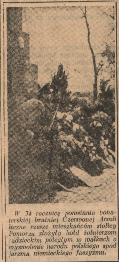
W 34 rocznicę powstania bohaterskiej bratniej Czerwonej Armii liczne rzesze mieszkańców stolicy Pomorza złożyły hołd żołnierzom radzieckim poległym w walkach o wyzwolenie narodu polskiego spod jarzma niemieckiego faszystwu.

Jak wiadomo CSR i Szwecja zdobyły po 12 pkt. przy czym Czechosłowacja miała lepszy stosunek bramek. W dodatkowym meczu zwyciężyła Szwecja 5:3 (0:2, 1:1, 4:0).