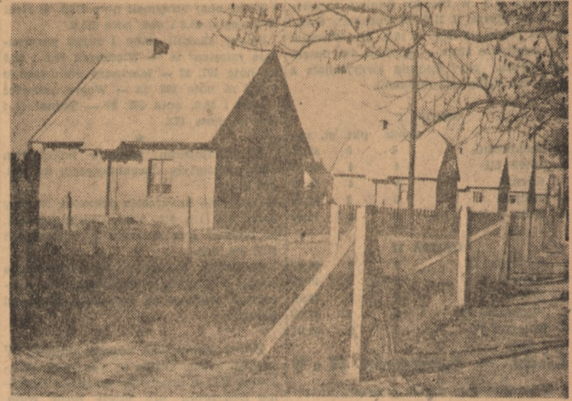
Zmienia się oblicze wsi polskiej. Na miejscu nędznych chat chłopskich powstają nowe, widne domki spółdzielcze. Na zdjęciu: Nowe domki spółdzielcze.