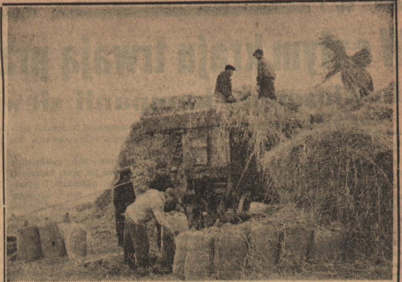
Zwiększenie powierzchni zasiewów zbóż jarych o 6,5 proc. w stosunku do roku ubiegłego, stawia przed rolnikami bojowe zadanie w przeprowadzeniu tegorocznej kampanii siewów wiosennych. Przygotowanie maszyn, nawozów sztucznych i ziarna — oto najpilniejsza praca w obecnym okresie przygotowawczym.