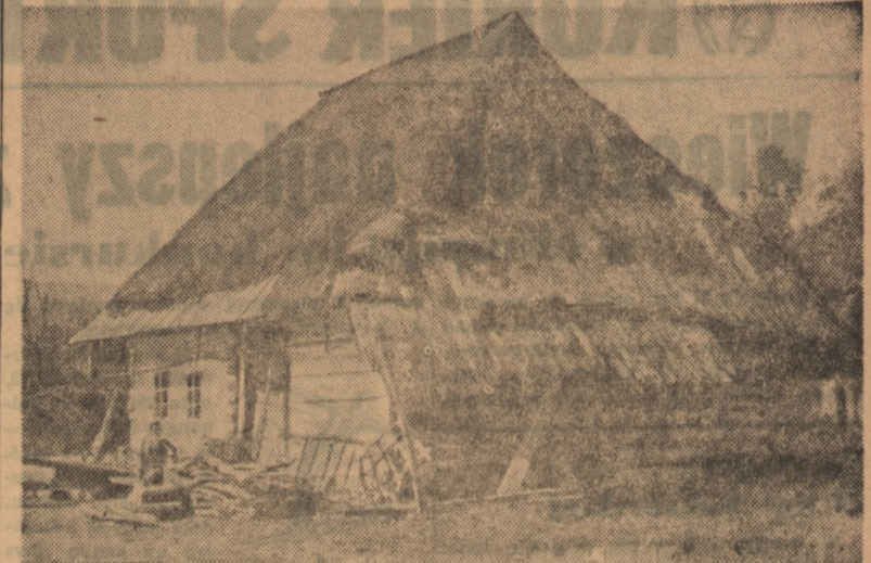
Warunki mieszkaniowe na przedwojennej wsi polskiej były zastraszające. Na zdjęciu: Kurna chata na Podkarpaciu.