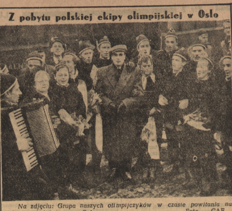
Na zdjęciu: Grupa naszych olimpijczyków w czasie powitania na dworcu kolejowym w Oslo.

Od obowiązku dostaw zwalniane są gospodarstwa rolne nie przekraczające 1 ha użytków rolnych należące do osób powyżej 60 lat, o ile w gospodarstwie nie ma członków rodziny powyżej lat 14, do osób odbywających służbę wojskową, o ile w gospodarstwie nie ma członków rodziny zdolnych do pracy poza jedną kobietą i dziećmi poniżej lat 14 i do osób posiadających 5 lub więcej dzieci poniżej lat 14.