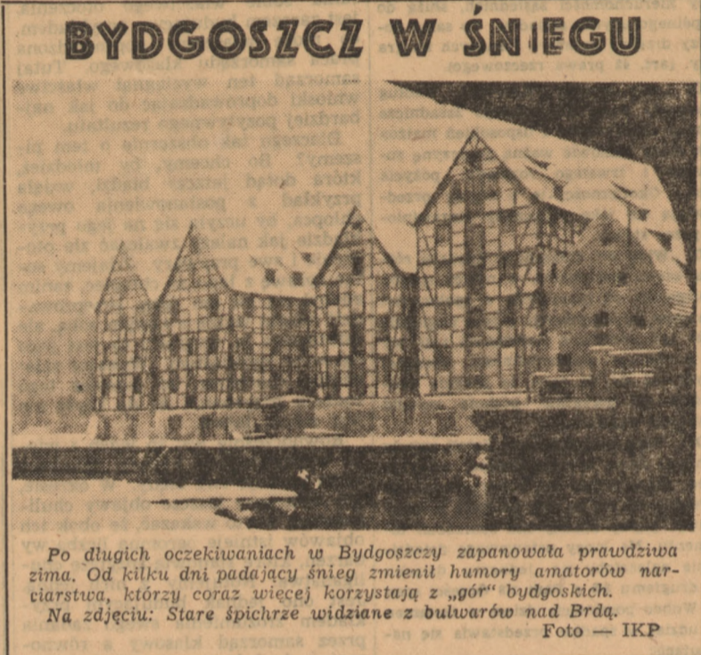
Po długich oczekiwaniach w Bydgoszczy zapanowała prawdziwa zima. Od kilku dni padający śnieg zmienił humory amatorów narciarstwa, którzy coraz więcej korzystają z „gó” bydgoskich. Na zdjęciu: Stare śpichrze widziane z bulwarów nad Brdą.

Fakt powyższy winny wziąć pod uwagę miarodajne czynniki, od których zależy zamiana obecnych pomieszczeń księgarń na odpowiedniejszą. Jak bowiem widzimy, ciasnota w księgarniach wpływa hamująco na upowszechnienie książki, która jest ważnym orężem w walce o budowę socjalizmu.