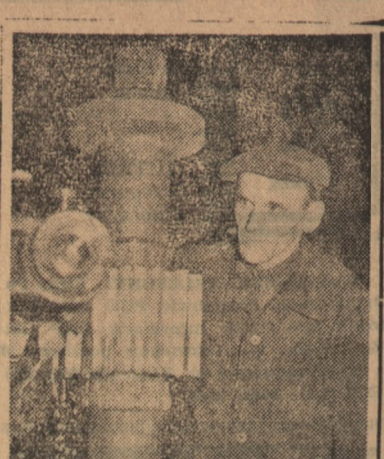
Fabryka Maszyn „Zawiercie” produkuje maszyny dla przemysłu budowlanego i ceramicznego...