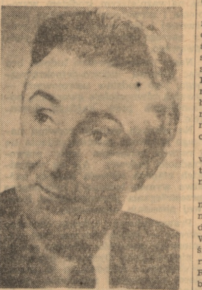
Noel - Noel

Amerikanie spychają francuską produkcję filmową na dalszy plan nie tylko