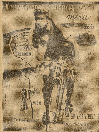
Plakat wydany w Czechosłowacji w związku ze zbliżającym się V Międzynarodowym Kolarskim Wyścigiem Pokoju Warszawa—Berlin—Praga, organizowanym przez „Trybunę Ludu”, „Neues Deutschland” i „Rude Pravo”.

Stal (Kat.) — Stal (Lipiny) 1:3 Budowlani (Opole) — Unia (Ch.) 3:0 Stal (Sos.) — Górnik (Michałkowiec) 5:1 Górnik (Radzionków) — Górnik (Rad.) 1:1