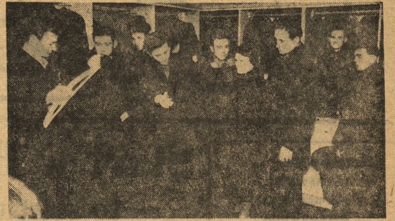
Sprzedaż odzieży na raty wzbudziła wśród bydgoszczan duże zainteresowanie. Klienci dowiadują się, w sklepach o warunkach sprzedaży, pobierają potrzebne formularze, inni przychodzą już po ubrania.

Klientów jest dużo w sklepie odzieżowym MHD przy ul. Dworcowej 42, ale ubrań starczy dla wszystkich.