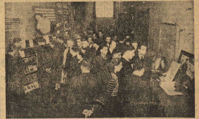
W niedzielę 23 bm. odbył się w Bydgoszczy VI Zjazd Okręgowy Towarzystwa Przyjaźni Polsko-Radzieckiej.