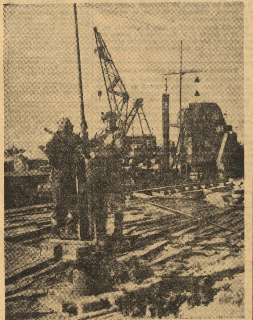
W Swinoujściu powstaje w szybkim tempie budowa nowoczesnej i jednej z największych w Europie, bazy rybackiej i kombinatu przetwórczego. NA ZDJĘCIU: Przemysłowe betonowanie pali pod halę rozdzielczą.

Zięba aż się przestraszył, kiedy przyszedł do niego Wróbel. Taką miał minę skwaszoną, jakby napił się octu.