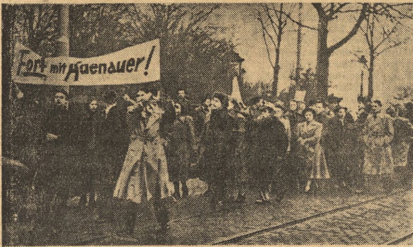
Podżegacze wojenni — wodzireje Wall-Street oraz ich marionetki z Bonn usiłują odgrodzić ludność Niemiec Zachodnich zapórą kłamstw od akcji pokojowej prowadzonej w NRD i poprowadzić naród drogą polityki wojennej.

Uczestnicy VI Walnego Zjazdu Okręgu TPRP w Bydgoszczy